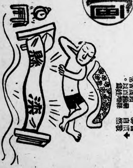
▶ 習慣戰 勝自然