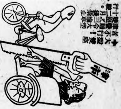
▶ 大型雙鹿 津警司令大型 雙鹿三輪車 行。後禁車 止