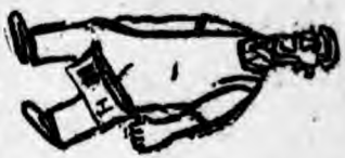
影電公司開辦，製片在倫敦，製片在倫敦。

他的故掌影電業，今年八月十一日，在巴黎逝世。他生前曾創設「影電公司」，專營影電業。他生前曾創設「影電公司」，專營影電業。他生前曾創設「影電公司」，專營影電業。