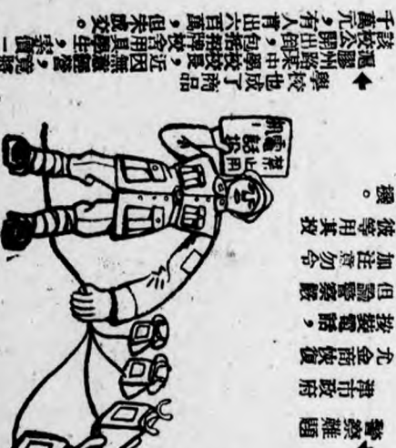
▶ 警察難題 津市政府 允金商恢復 接裝電話， 但驗警察 加注意勿 彼等用其技 機。