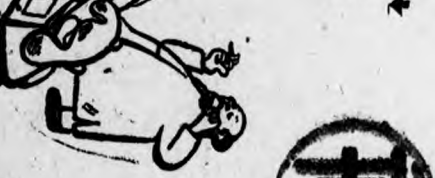
▶ 謎？ 有人相信希冀仍生 存于柏林地下。