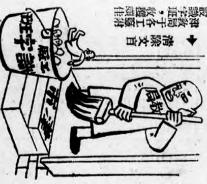
▶ 清除文盲 設速教高子各工發 識字班，收效頗佳