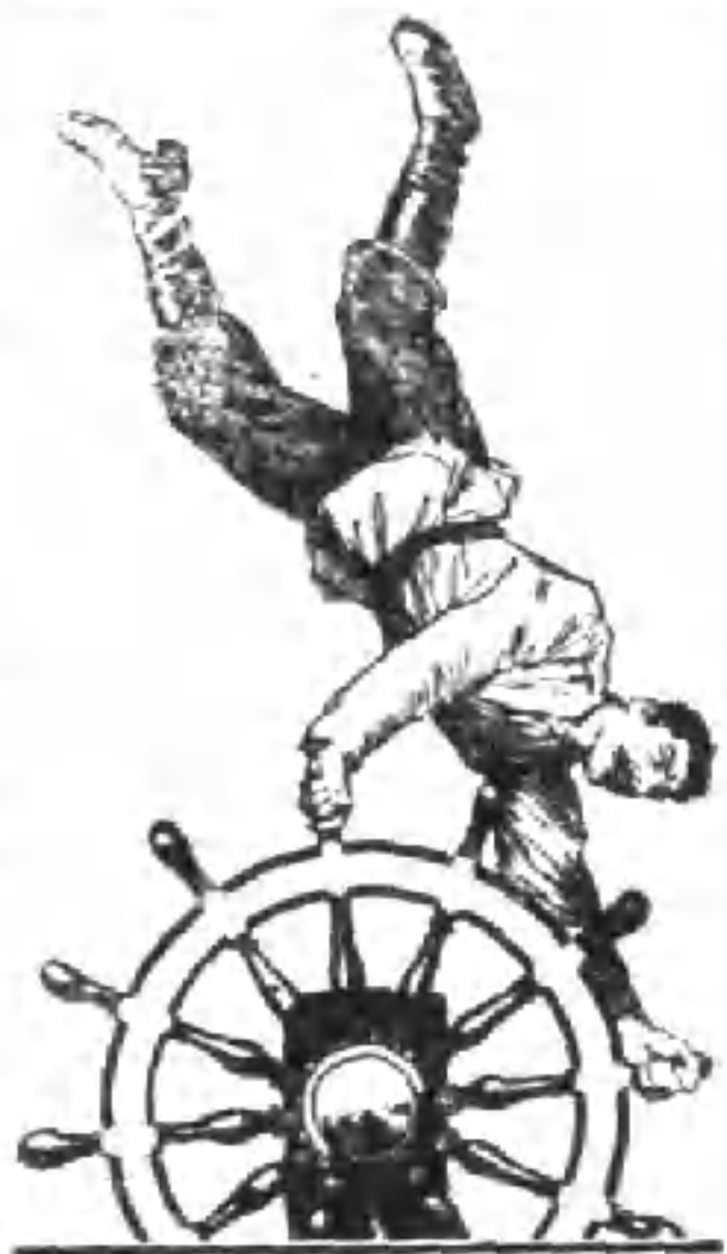
Stalin at the Helm "We are dizzy with success!" — "De Groene Amsterdammer" 斯達林在舵上 我們給成功迷眩了啊 De Groene Amsterdammer 報

國的國情，是不是可以平安的駛過去？或者從困難中另闢新運？這個問題，我們要舉出事實來去研究。 第二工人的工作效能太低，在最近過去的五年當中，工人的效能，不但沒有進步，反而呈現着退化，出品也就不良，最大的原因，是工人偏重於工運太多，不願把時間放在研究技術裏。而且不肯接受廠方的指導，他們天天離遠工廠，而終年終日的在糾紛的漩渦裏旋轉。