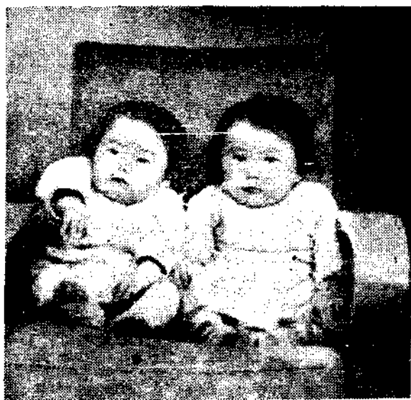
？平平是個那？和和是個那

1. 種牛痘——和和、平平在三個月大的時候，佈種牛痘，以防天花。一切現象都很正常。在種牛痘後第七、八天發了一夜燒，灌漿很足，以後慢慢結了痂。 2. 種接卡介苗——我國結核病非常流行。在嬰兒時期接種了卡介苗可以預防結核病。上海市肺病中心診所每星期二、五下午為市民接種卡介苗。和和、平平在六個月大的時候接種卡介苗，以增加抵抗結核菌的能力。一般兩個月以上的孩子先做結核菌