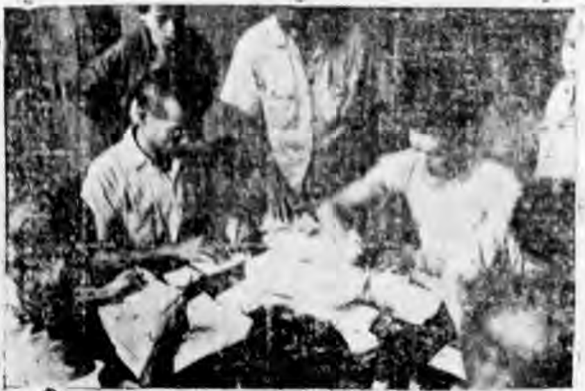
換一次發給副食費