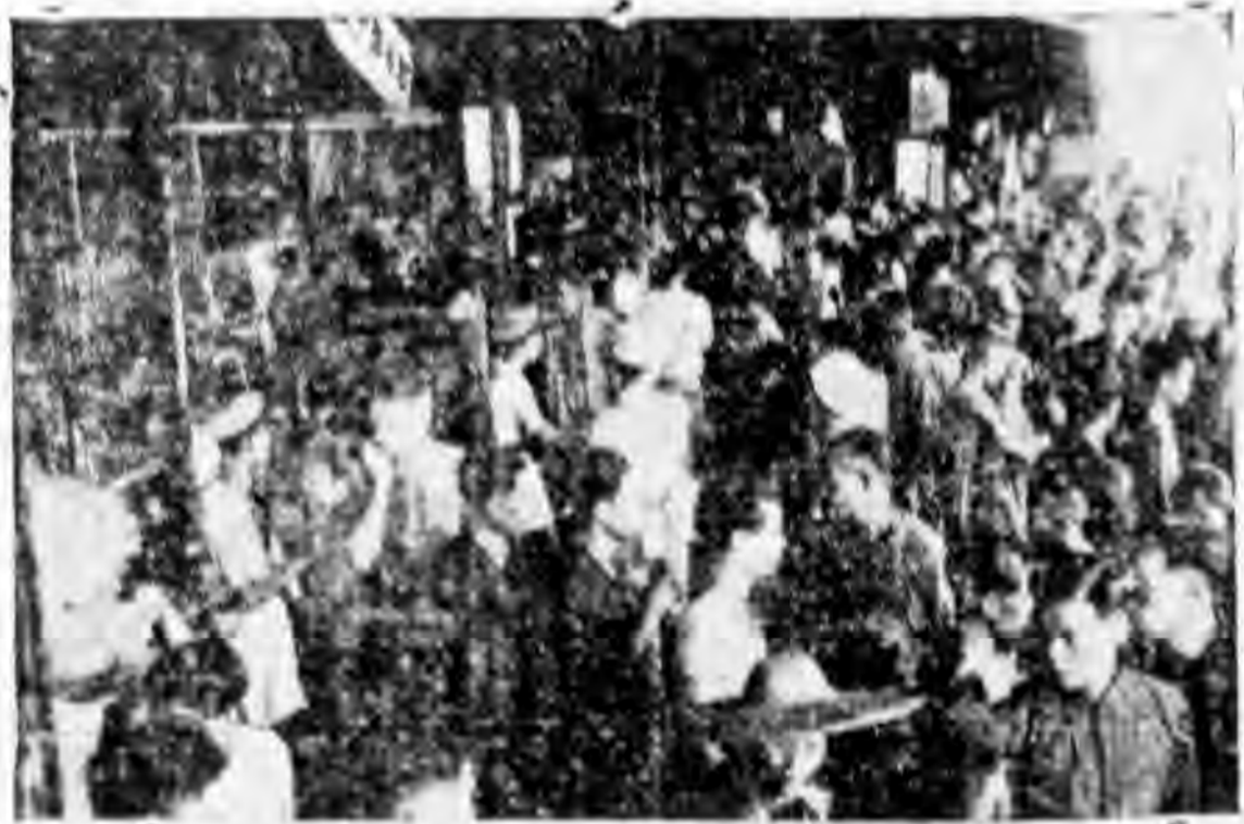
擠在碼頭準備歸鄉去