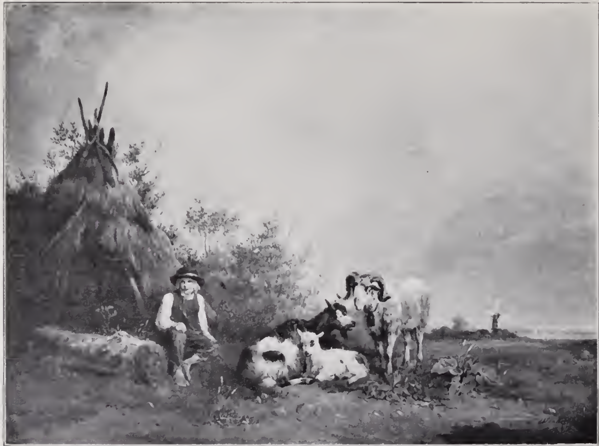
LANDSKAP MED VALLGOSSE. Oljemålning 1837. Heleneborg.