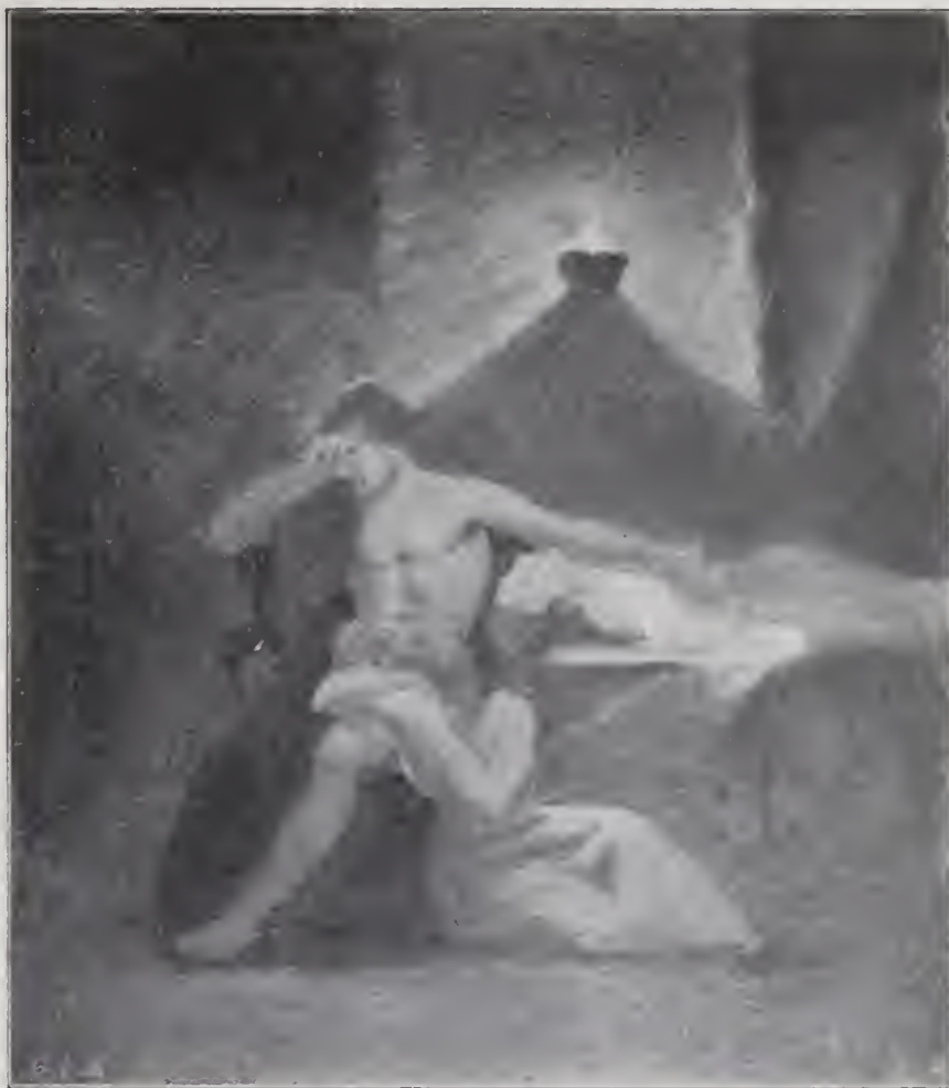
ADAM OCH EVA VID ABELS LIK.