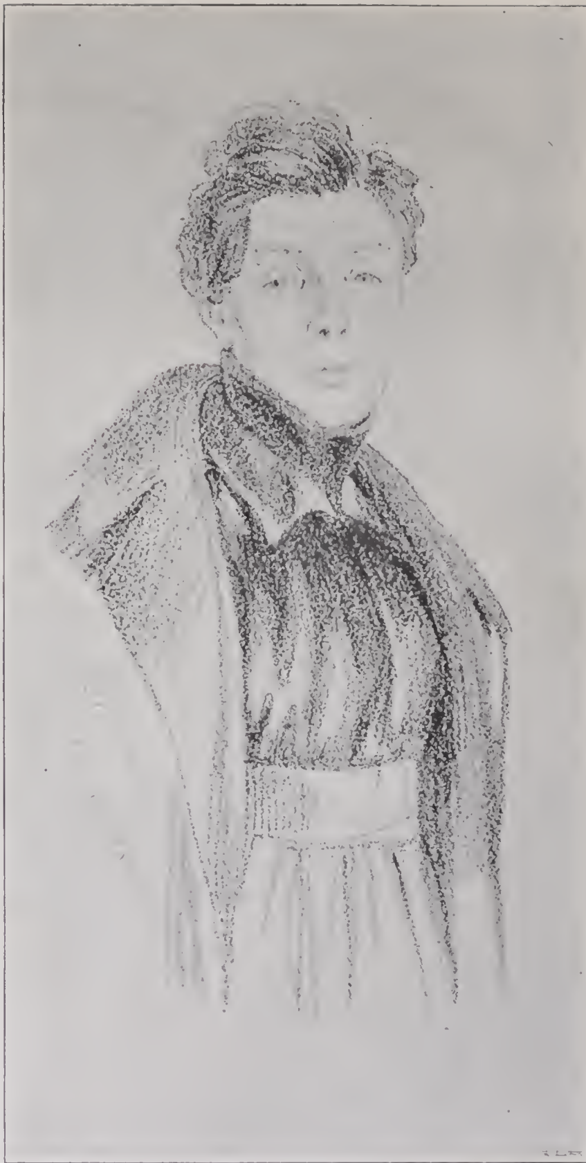
PORTRÄTT AF WICKENBERG 1835.