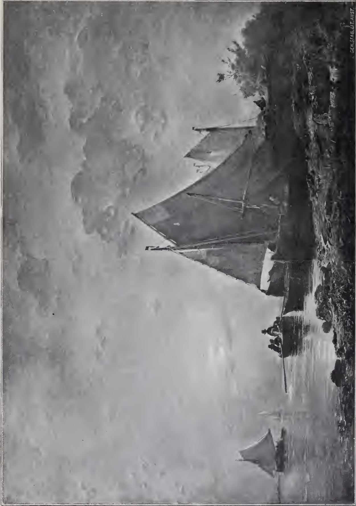
HOLLÄNDSKT KUSTPARTI I MÄNSKEN. Oljemålning 1841. I Nationalmuseum.