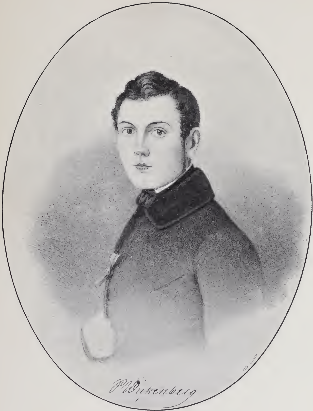
PORTRÄTT AF WICKENBERG. Litografi af O. Cardon efter oljemålning af J. A. Wetterbergh.