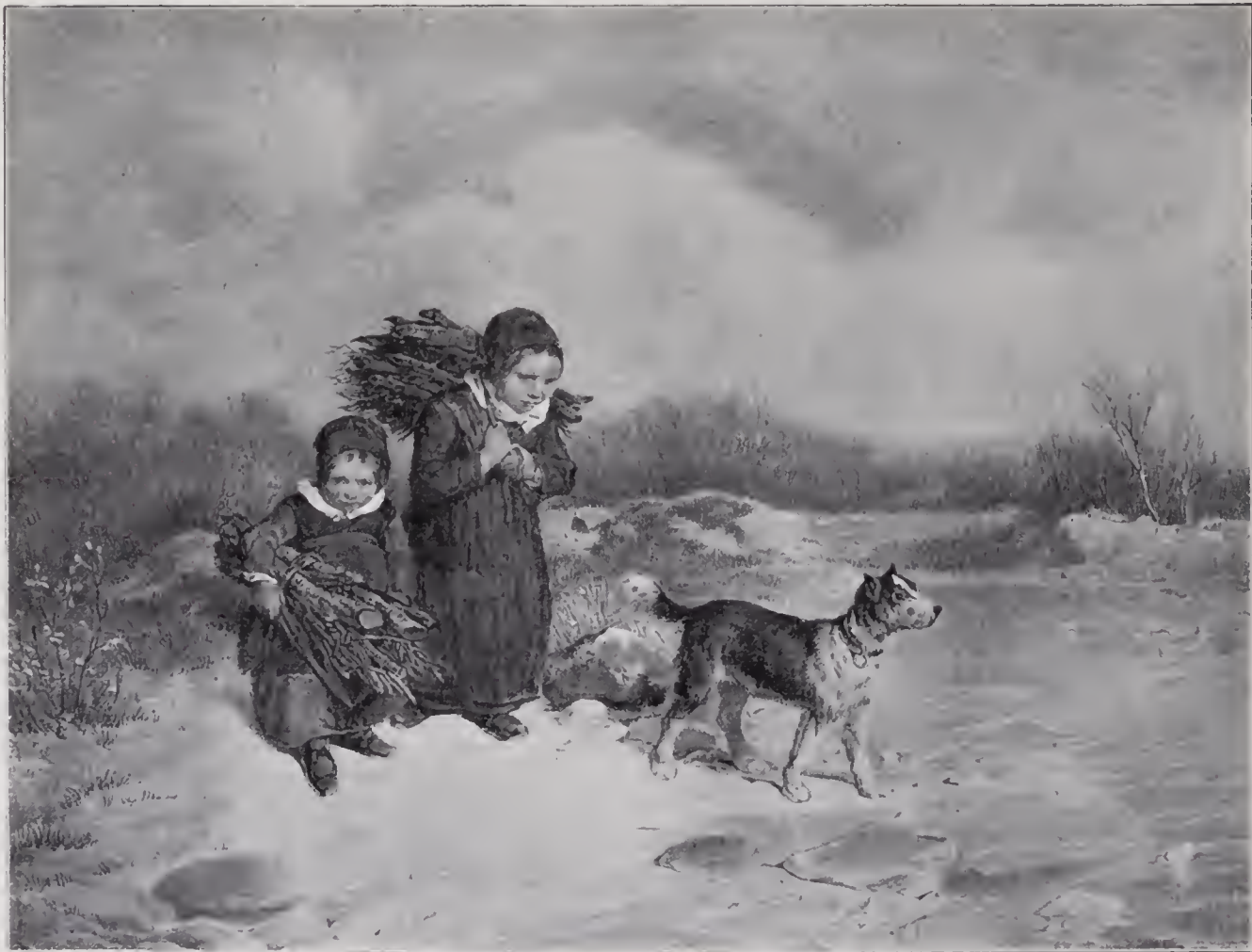
BARN HEMFÖRANDE BRÄNSLE.