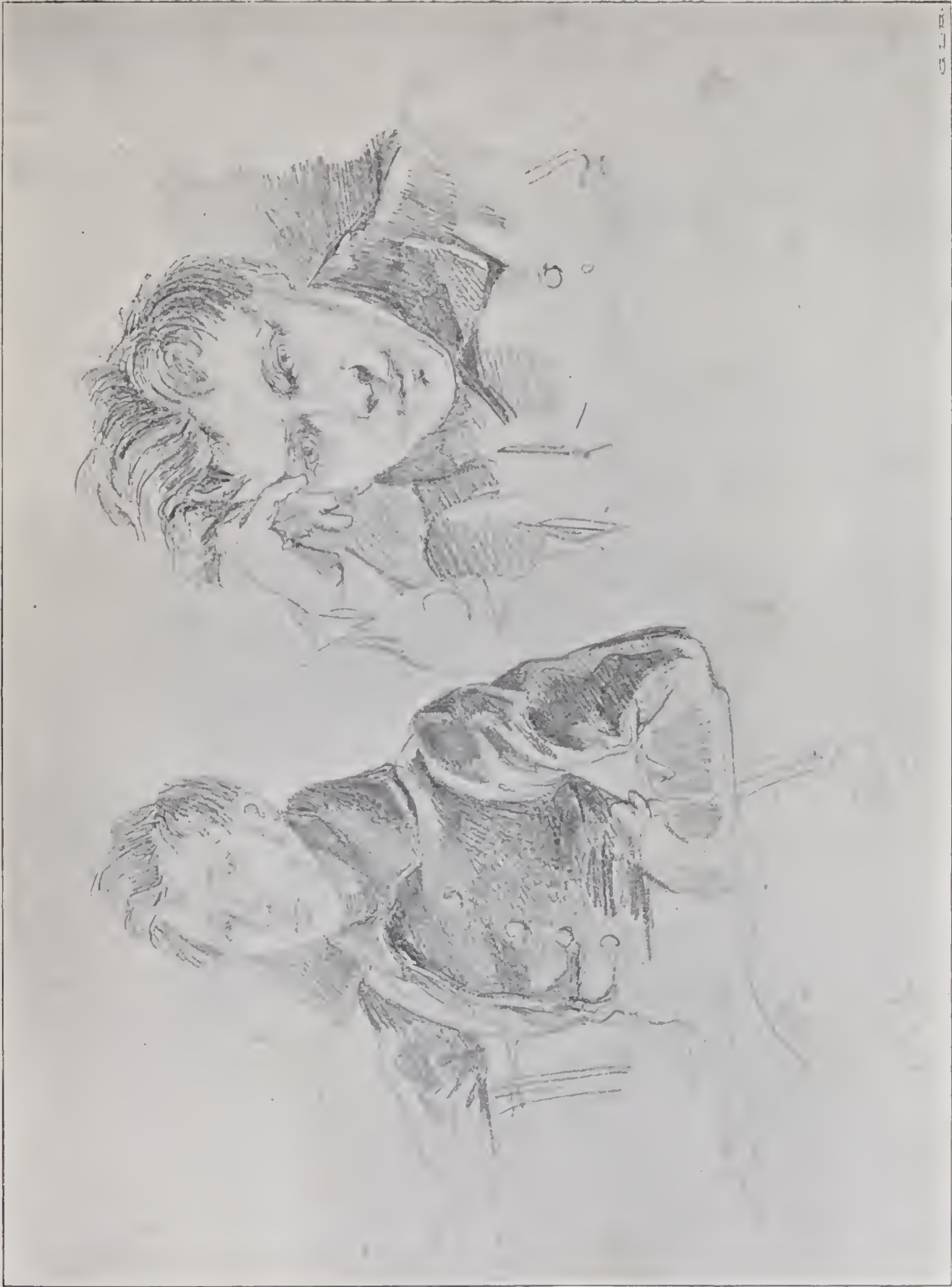
PORTRÄTT AF WICKENBERG 1835. Blyertsteckning af J. W. K. Wahlbom. I Nationalmuseum.