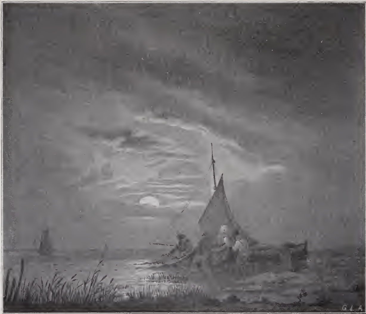
FISKARE VID MANSKEN.

Litografi af O. Cardon, efter oljemålning 1835.