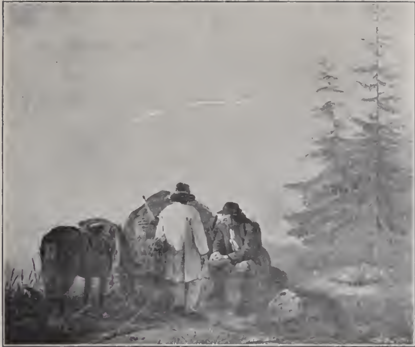
DALKARLAR VID ETT LASS.

Oljemålning 1836. Uppsala universitets konstmuseum.