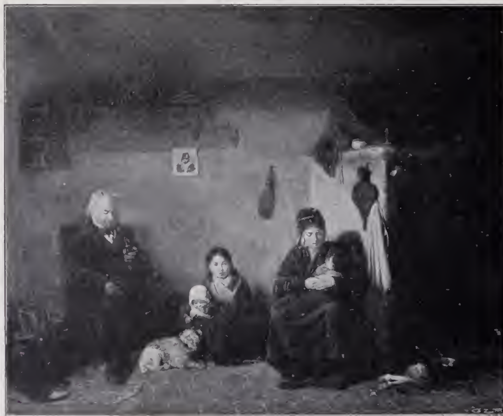
FRANSYSK FAMILJESCEN. Oljemålning 1838. II. M. Konungens samling å Stockholms slott.

Landskapet , hvilket nu befinner sig i Nationalmuseum, är ett litet kreaturstycke med en stående vit- och rödbrokig tjur sedd i profil, framför honom en liggande svart-hvit ko samt något i bakgrunden en get med sin killing i ett slättlandskap med en ljus gråhvit himmel och blå lointain. Det är ett synnerligen vackert litet stycke i Paul Potters art med en frisk och nobel silfverton, god