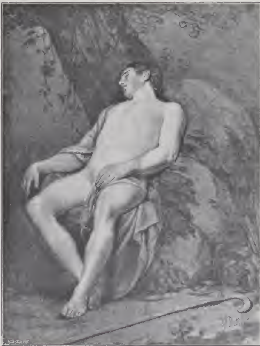
MODELLSTUDIE TILL EN ABEL. Teckning i krita. I Nationalmuseum.