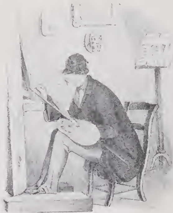
WICKENBERG I SIN ATELIER. Litografi efter samtida teckning.

Om man kunde tänka sig den himmelskriande skillnad mellan hagkomsten af Malmö och hvad man der omgifves af, med det, som för närvarande utgör platsen för min verksamhets krets, Pappa skulle i sanning häpna öfver hur människor äro sig olika och huru världen är underbar — att vilja försöka skildra hvad jag här ser och hör, vore ett vanvett, ty någon föreställning derom är omöjlig — jag tiger därför om Paris och säger blott att den som sedt Paris, vet hvad människan är, förmår, men därför icke hvad den bör vara. För öfrigt berättar han, att han är tillsammans med landsmän alla dar, mår bra och fröjdar sig öfver att kunna arbeta samt tillägger: »Jag har mycket att göra och min framgång i konst etc. är i tilltagande i samma mån jag rigtar min erfarenhet i konstväg. Jag har flera beställningar fran Berlin, utom dess hvart jag vänder mig får jag mina arbeten betalta — således: helsa och ingen nöd och det är det bästa.»