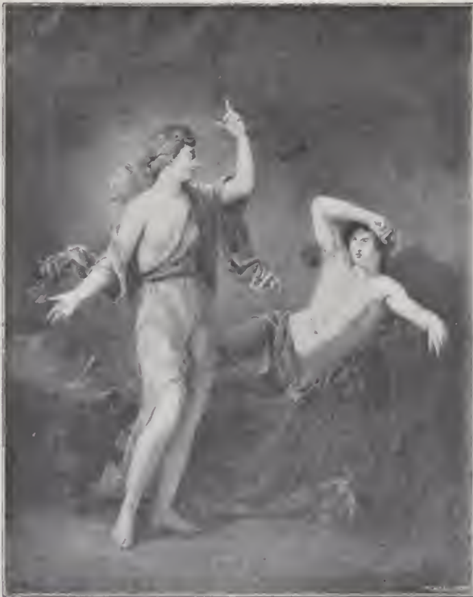
IRIS OCH MORPHEUS.

Konstföreningen anordnade 1833 en specialutställning af gamla nederländska mästares arbeten och gaf härigenom ökad näring åt intresset för denna gren af konsten. Redan vid föreningens första utställning året förut, da äfven de andra gamla skolorna voro representerade, hade, anmärker en recensent i Svenska Litteratur-Föreningens Tidning (1833, n:r 27) flertalet af betraktare företrädesvis fäst sig vid de Nederländska målarna. I förordet till katalogen öfver denna nederländska utställning heter det: Konstföreningen har ansett lämpligast att börja special-expositionerne med