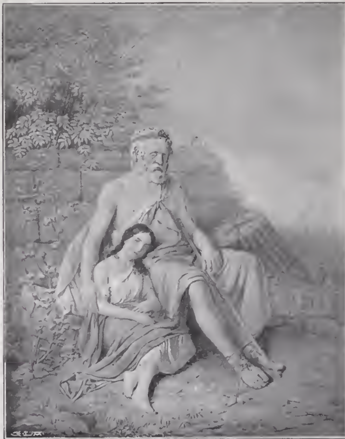
OIDIPOS OCH ANTIGONE.