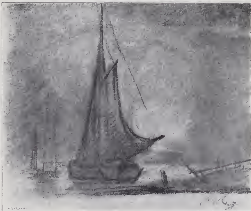
BATAR I MÅNSKEN.