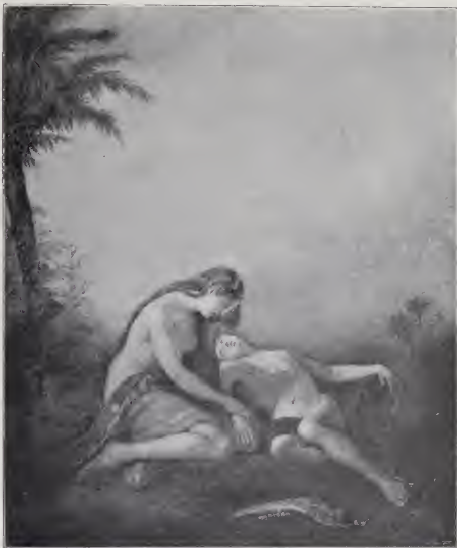
EVA OCH ABEL.