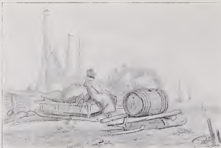
BONDE OCH SLÄDE.

de båda Nederländska skolorne, emedan i dem naturhärmmningen, grunden för all bildande konst, vanligen framträder sjelfständigt och i sin enklaste form, utan urval af föremål och utan ideell syftning. Kännedomen af dessa skolor synes alltså böra föregå den af de Italienska, der naturhärmmningen upphör att vara föremål, der den är medel till försinnligande af en stor idé och höjer