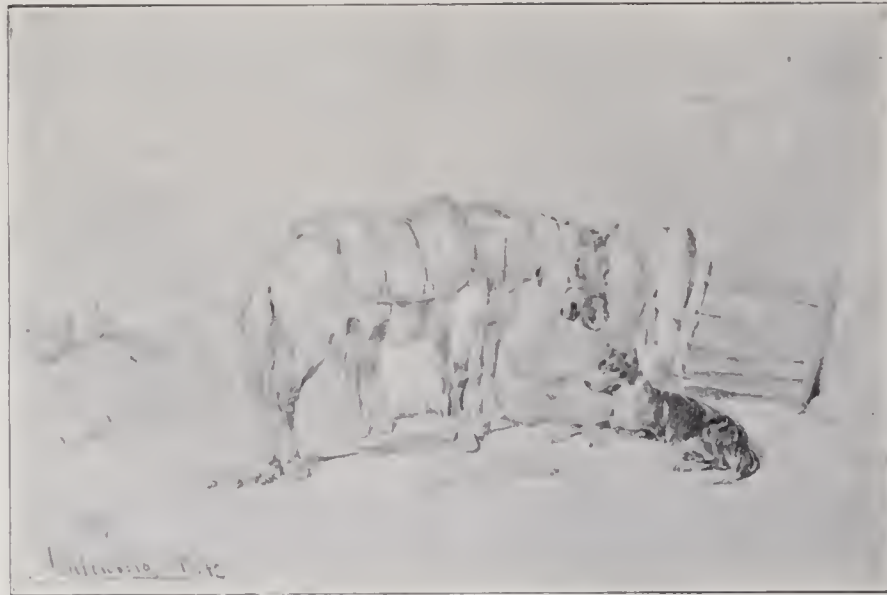
HÄSTAR OCH HUND.