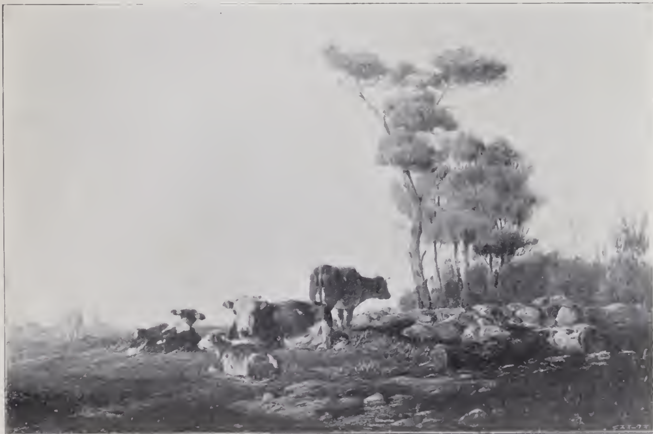
VÅRLANDSKAP MED KREATUR.

Närmast i tiden af Wickenbergs i Sverige förvarade arbeten följer hans stora holländska vinterlandskap i Nationalmuseum, utfördt i Paris 1840 och inköpt af Karl Johan följande år för 1,000 kr. Den har samma motiv som många gamla holländare, Isack van Ostade, Adrian van de Velde m. fl. ofta varierat: en isbelagd flod med några halmtäckta hyddor och risiga träd vid stränderna, skridskogångare och infrusna båtar. Men hur nytt och friskt värkar icke det gamla motivet, luften med de lätta, hvita molnen, bakom hvilka blå himmel och solljus skymta fram, den speglande fasta isytan och den upphuggna vaken med skimrande klargröna isstycken, hyddorna med sina höga tak, där snön ligger och smälter på mossans gröna sammet, den kalla stålblå lointainen, mot hvilken aftecknar sig en gående figur, som kastar en speglande strimma på isen, och så, midt i allt, den koloristiskt upplifvande gruppen med den hvita hästen, vagnen med den lysande gula halmen och människorna i sina dräkter i rött, brunt och grönt, hvilka äro så färgstarka och behagliga i sin diskreta brokighet. Man kan om och om igen njuta af detta friska och fina stycke, hvars stora