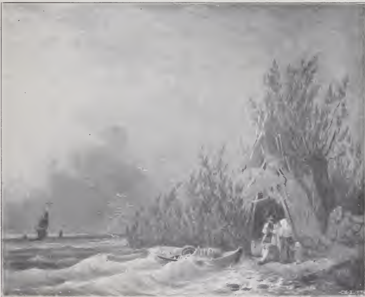
KUSTBILD. Oljemålning 1836. Tillhör Generalkonsul Heiborn, Djursholm.

landskap (grosshandl. O. Seippel, Stockholm) och det tredje Dalkarlar vid ett lass (Uppsala universitets konstmuseum). Kustbilden , som visar en bonde- eller fiskarfamilj invid en ris- hydda och några videbuskar på stranden i blåsväder, är ett ganska känsligt och fint stycke, kraftigt om ock en smula hårdt med sina skummande grönhvita vågor, hvita fiskmåsar och den mörka ovädershimmeln med gult och rödaktigt skimmer i luften. Det erinrar icke så litet om Wickenbergs kamrat Berger. Af ett mycket beslägtadt tycke är det lilla vinterlandskapet , intressant såsom det, mig veterligt, första af Wickenberg i denna art, som längre fram blef hans alldeles särskilda område. Motivet synes vara hämtadt från Stockholms omgifningar. På ena sidan ser man ett par stugor nedanför en ganska