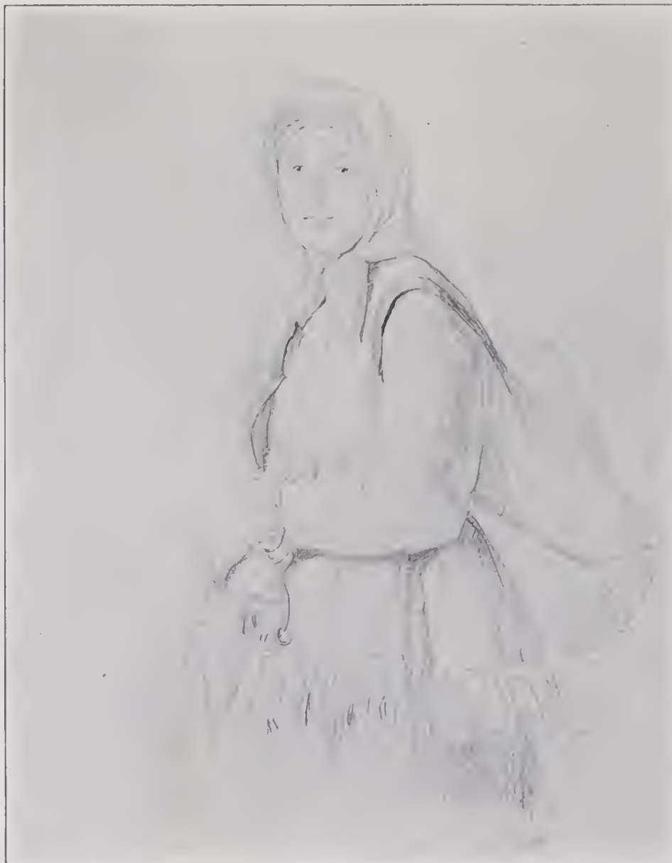
DALKULLA FRÅN MORA.

Denna förening blef de fattiga konstnärernas räddning, de sluppo att längre anlita klädståndsfruarna och fingo en om också anspråkslös betalning för sina produkter. Flera af dem ingingo