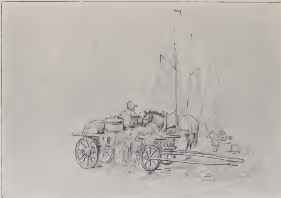
BONDVAGN OCH BATAR. Blyertsteckning. I Nationalmuseum.