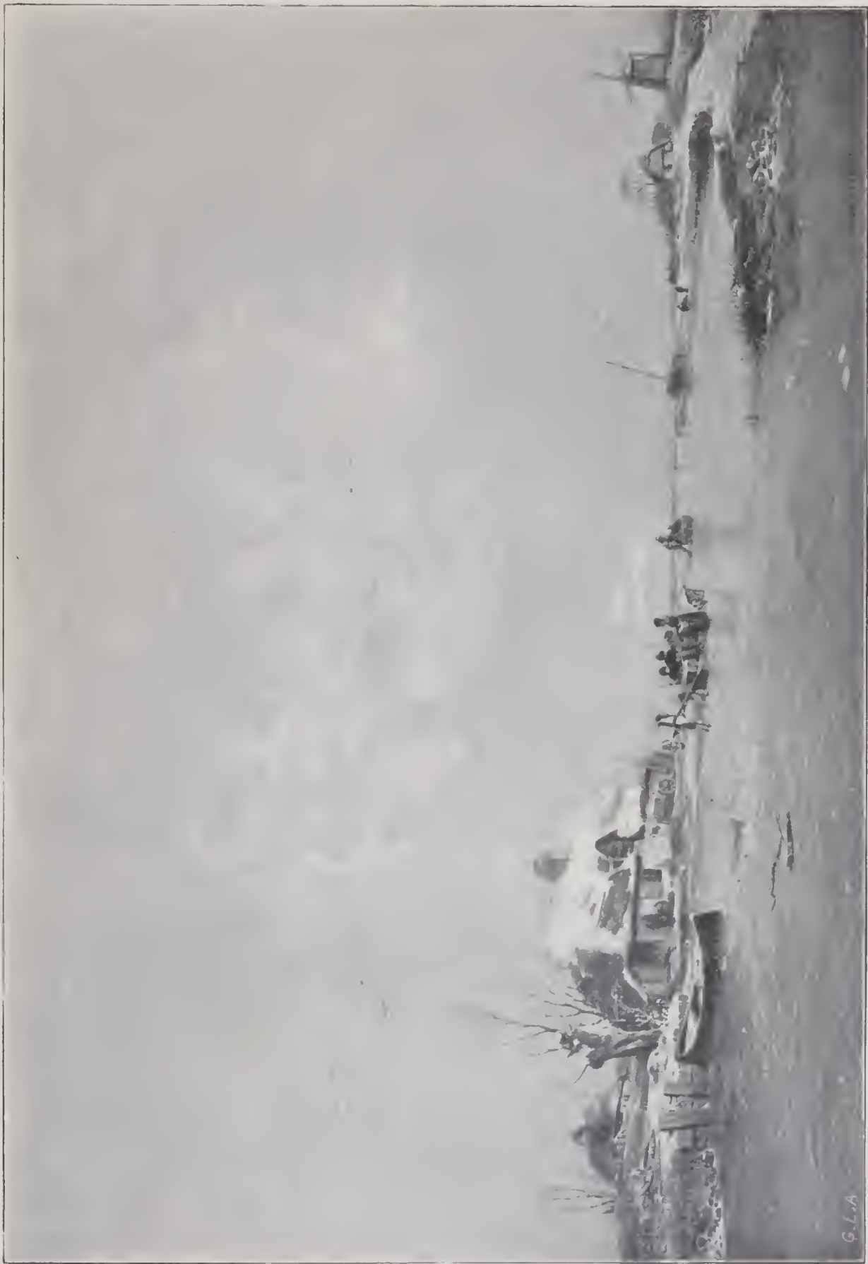
HOLLÄNDSKT VINTERLANDSKAP. Ojemåning 1840. I Nationalmuseum.