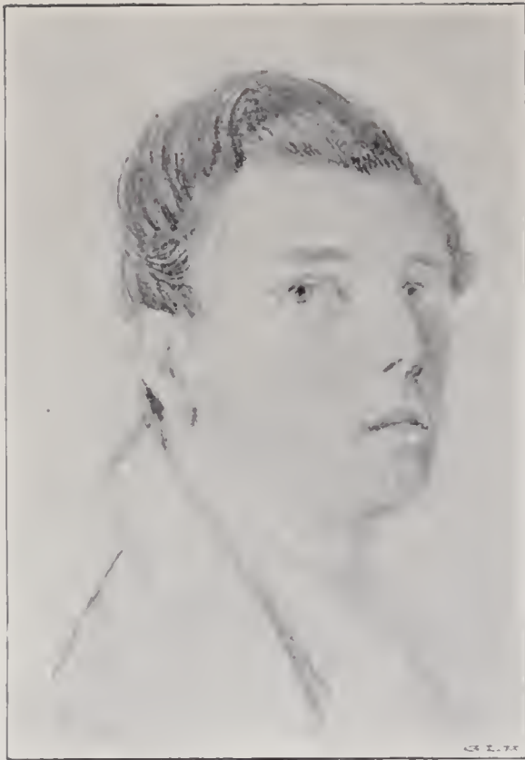
PORTRÄTT AF WICKENBERG.

Blyertsritning af Hugo Leffler. Tillhör Generalkonsul Heilborn, Djursholm.