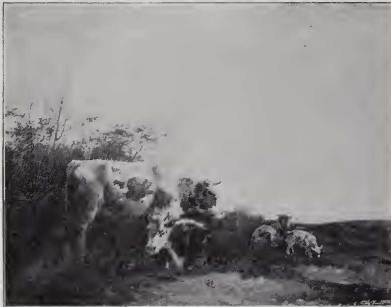
KREATUR I ETT LANDSKAP. Oljemålning 1838. I Nationalmuseum.