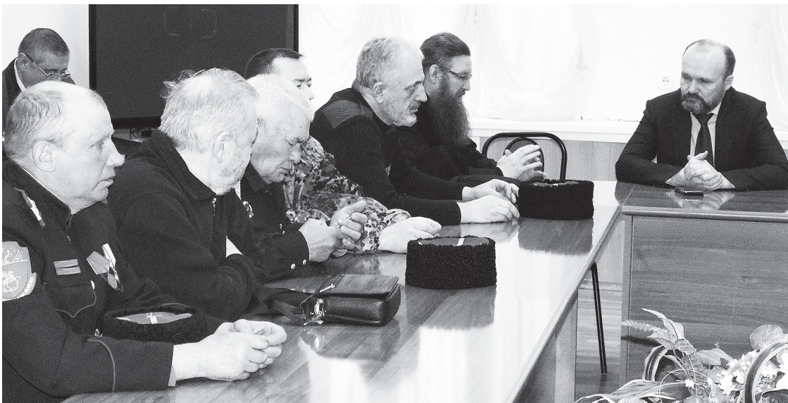
Встреча по поводу