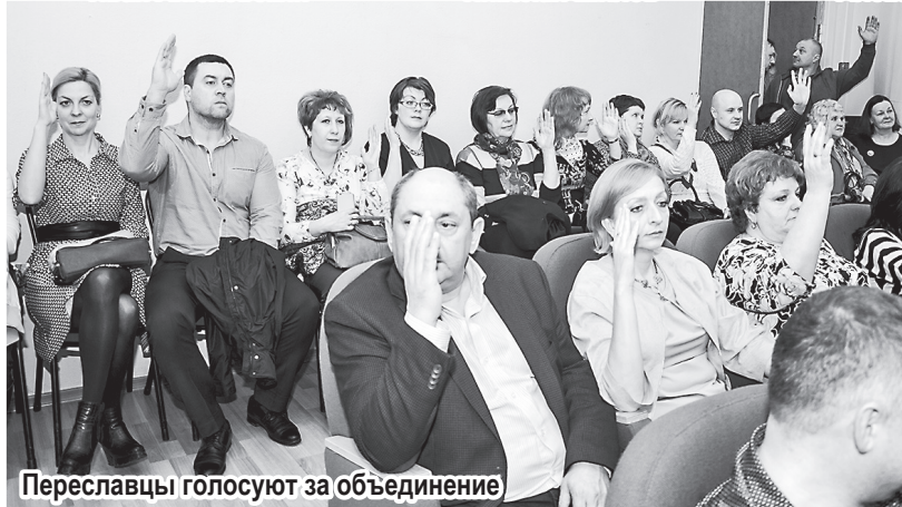
Переславцы голосуют за объединение