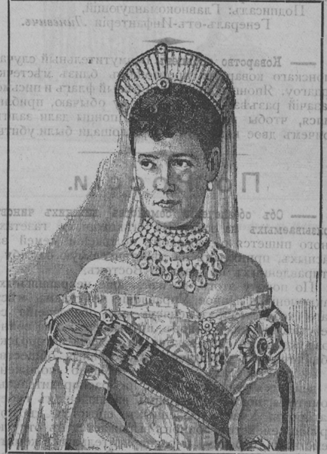
Ея Императорское Величество

Послѣ неудачныхъ для японцевъ попытокъ произвести усиленную развѣдку нашихъ позицій, для чего неприятель переходилъ въ наступленіе мелкими отрядами, на передовыхъ линіяхъ праваго крыла и центра нашей арміи наступило затишье. Но такъ какъ ходили слухи о томъ, что японцы пытаются обойти нашъ лѣвый флангъ, т. е. восточное крыло нашей арміи, съ цѣлью отгнать наши войска отъ путей къ Владивостоку, то 7-го юля была произведена усиленная развѣдка расположенія неприятельскихъ войскъ, стоящихъ противъ нашего лѣваго фланга. Для развѣдки этой посланы