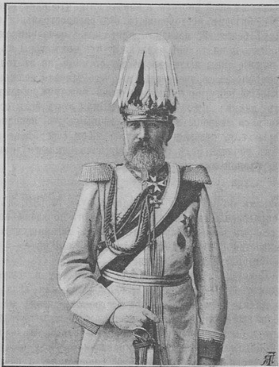
Командиръ VII-го (вестфальскаго) армейскаго корпуса, генераль-отъ-кавалеріи Эмиль фонъ-АЛЬБЕДИЛЬ.

Родился 1828 г. Служилъ, въ 1845 и 1846 гг., вольноопредѣляющимся въ 5-мъ прусскомъ уланскомъ полку. Когда, въ 1848 г., Гольштинское населеніе возстало противъ датскаго правительства, молодой дворянинъ фонъ-Лоэ находился въ числѣ тѣхъ, которые съ одушевленіемъ сѣгнули въ ряды Гольштинскихъ войскъ. Онъ принялъ участіе въ бою и получилъ чинъ офицера Гольштинской конницы. По окончаніи войны онъ вступилъ въ Прусскую службу подпоручикомъ въ 3-й Гусарскій полкъ. Съ 1855 по 1857 г. слушалъ курсъ военной академіи. Въ 1857 г. произведенъ въ поручики, а въ 1858 г. въ ротмистры вмѣстѣ съ переводомъ въ 7-й Гусарскій полкъ. Въ 1858 г. назначенъ личнымъ адъютантомъ къ Прусскому принцу Вильгельму, а 3 года спустя назначенъ флигель-адъютантомъ къ Прусскому королю. Въ чинѣ майора онъ сопровождалъ Прусскаго принца Карла на Кавказъ въ 1862 г. Съ 1863 по 1867 г. онъ былъ прикомандированъ къ Прусскому посольству при французскомъ дворѣ; въ 1864 г. онъ принялъ участіе въ походѣ французскихъ