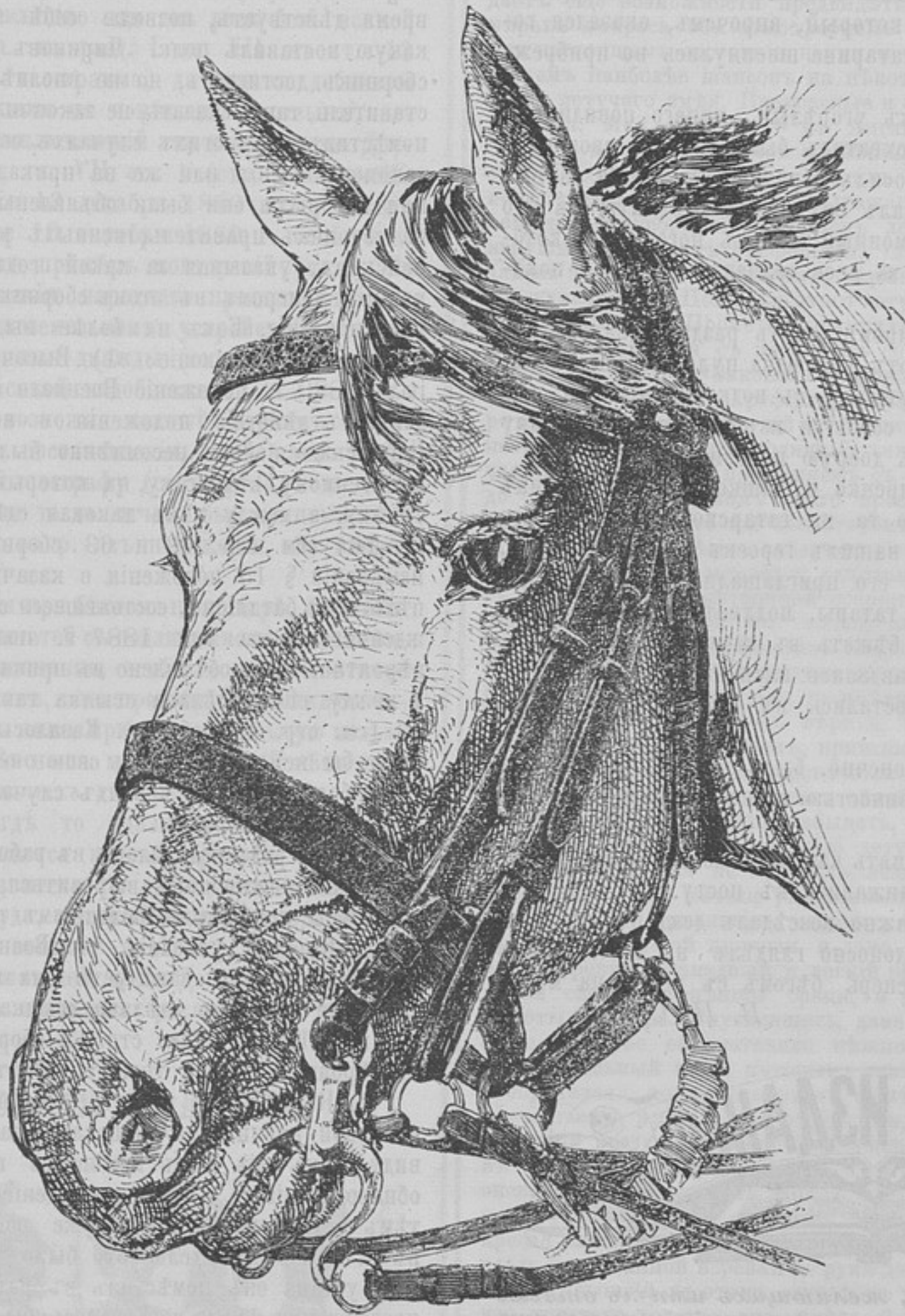
Типы итальянскихъ лошадей. Солдатская.

— Ну, будь я проклять, если еще разъ рѣшусь совершить такую глупость, злобно проговорилъ докторъ.