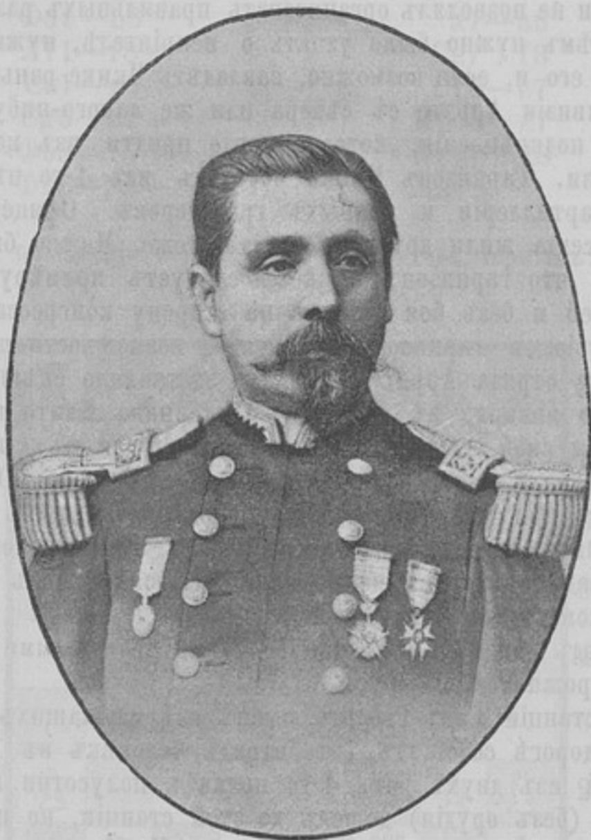
Полковникъ Донъ-Эстанислао Дель-Канто.

Впереди, метрахъ въ 600-хъ или 700-хъ, тянулась цѣпь