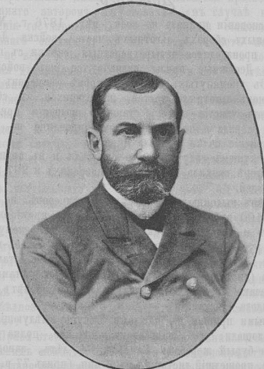
Капитанъ 1-го ранга Донъ Хорхе Монтъ (нынѣшній президентъ Чили).

На правомъ флангѣ десятка два или три артиллеристовъ подъ начальствомъ юнаго прапорщика быстро прошли черезъ