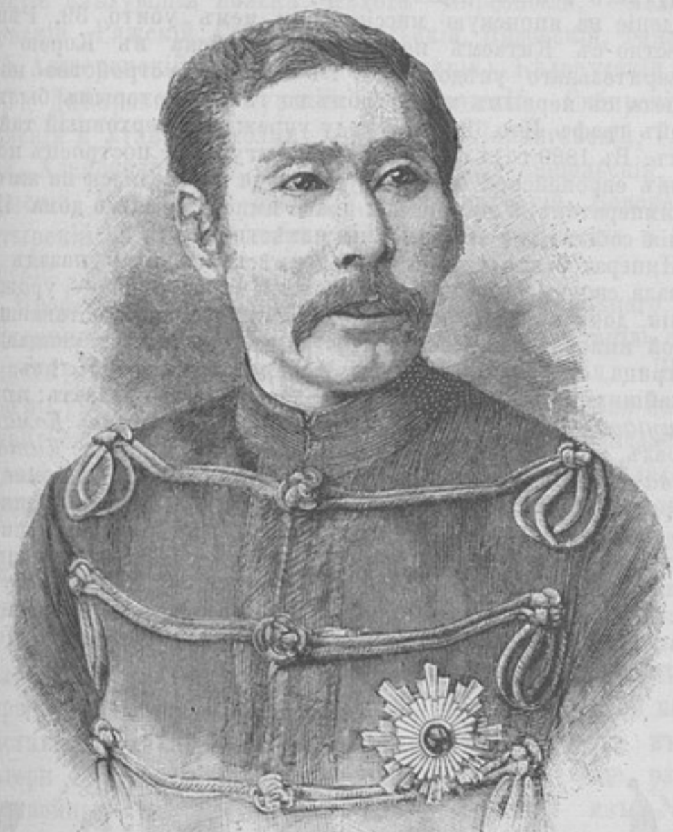
Главнокомандующій японской арміей