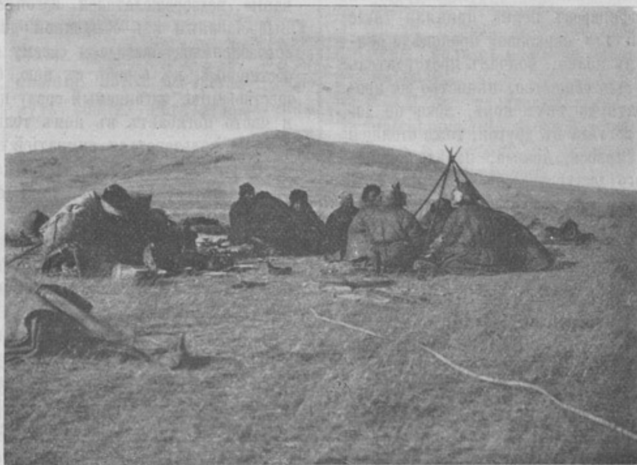
Экспедиція въ Монголію, на приездѣ (къ корр. «Омскъ»).