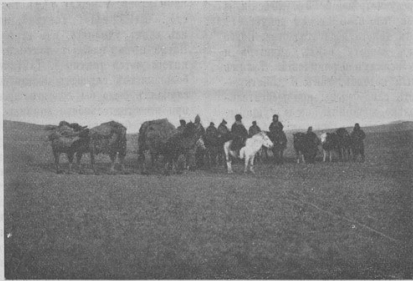
Экспедиція въ Монголію, въ пути (къ корр. «Омскъ»).