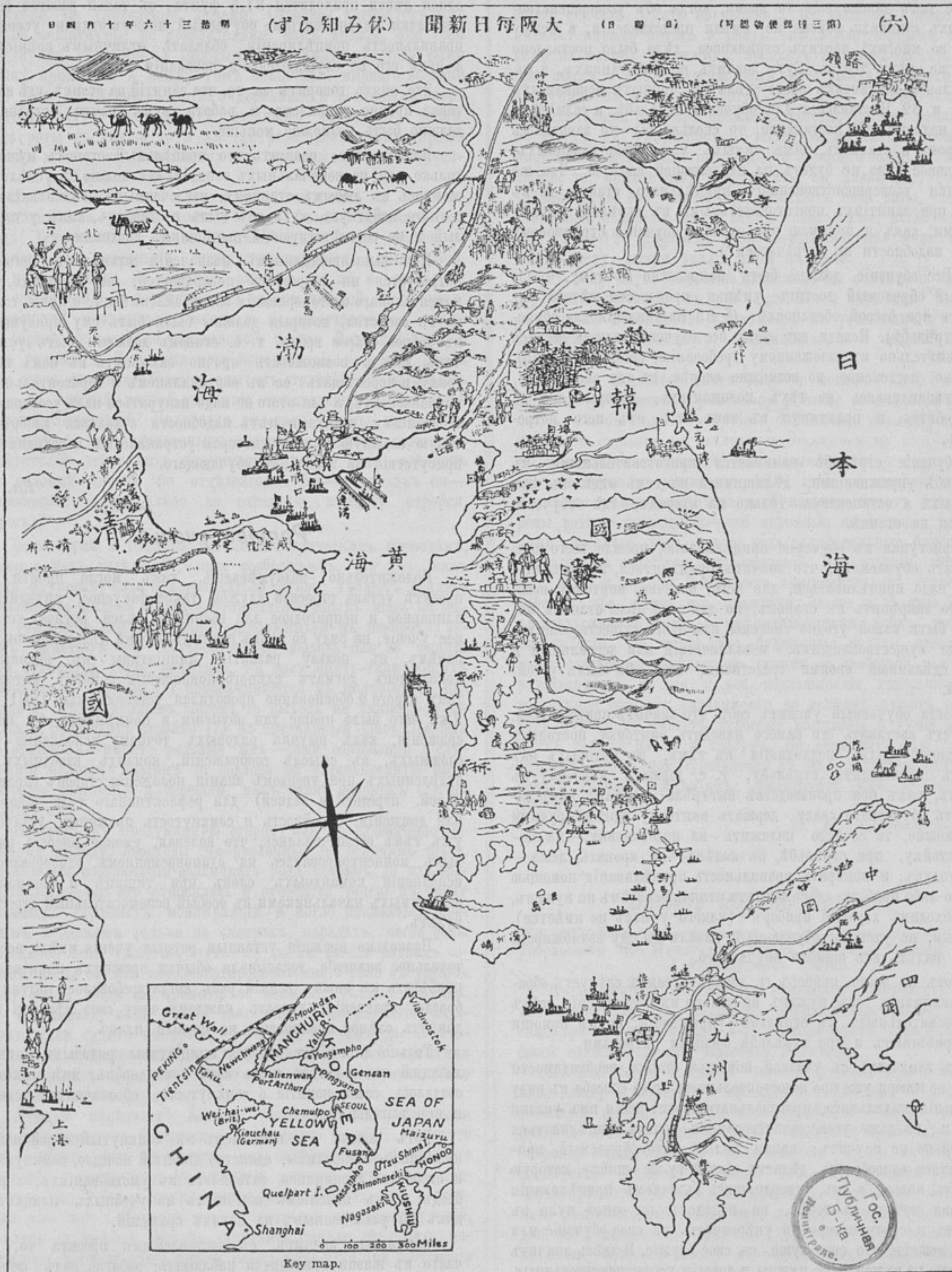
Оригинальная японская карта Кореи, съ иллюстраціями изображающими современное политическое положеніе, силы и расположеніе флотовъ, а также флору и фауну.

себѣ такого широкаго распространенія въ войскахъ, какое получилъ, въ послѣднее время, усовершенствованный прицѣльный станокъ. Этимъ станкомъ занялись многіе изобрѣтатели, и въ результатѣ явилась цѣлая серія рекомендованныхъ станковъ и громадное количество — не выдер-