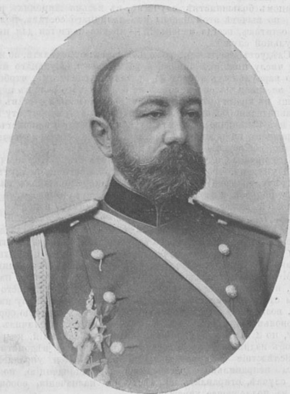
И. д. коменданта Ивангородско крѣпости, генераль-маіоръ

Сборникъ избранныхъ пѣсень для солдатскаго хорового пѣнія собранъ и съ голоса на ноты положилъ П. Ф. Егоровъ. 3-е изданіе. . . . . 1 р.