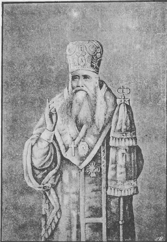
Епископъ Теофанъ, Вышенскій затворникъ.