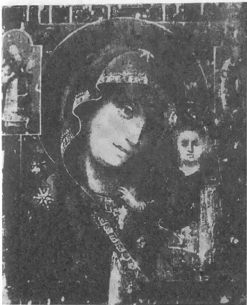
Казанская икона Божией Матери, написанная епископом Феофаном