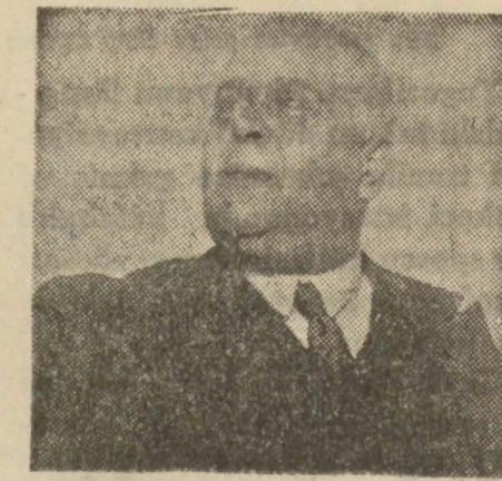
Haydar Rifat Bey

— Mahpuslar size karşı nasıl muamelede bulundular? Galatasaray'la, dördüncü gününde Fenerbahçe ile karşılaşacak, pazar günü de bu üç takımın muhtelili ile son maçını yapacaktır. Çünkü nüshamızda da işaret ettiğimiz çeşitli Yugoslavya'lı futbolcular çok kuvvetlidir, bunlarla yapacağımız müsabakalar bizim için çok mühim olacaktır.