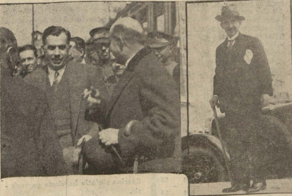
Dün şehrimize gelen Başvekil İsmet ve M. Reisi Kâzım Paşaların istikballerine ait nitibalar

Adliye Vekili Yusuf Kemal Bey de bayramı geçirmek üzere geldi