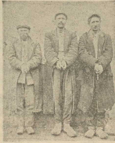
İnsan şeklinde 3 canavar