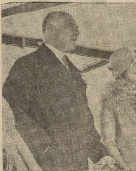
Lord Athlone ve refikası

Yekpare vatanda cemiyetin tesanüdü milletin yekpareliğini teyit eden çok yüksek bir esastır.