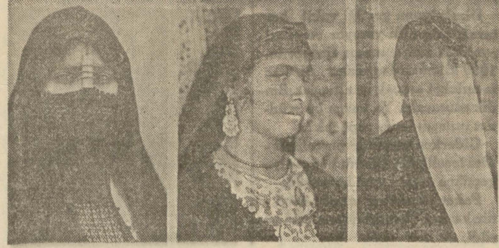
Mısır kadınlarından ve kadın kıyafetlerinden üç nümune Bur'ulu Mısır kadını Yüzü açık jellâh yani köylü kadını Yaşmaklı ve başörtülü ve şehirlî kadın

Mısır'daki Türk'lerin miktarı 35-40 bin kadar tahmin edilmektedir