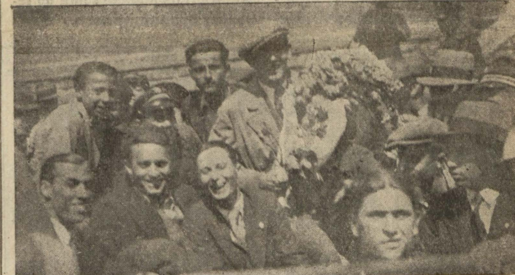
Dün şehrimize gelen Sırp takımı oyuncularını müstakiblin arasında

Beogradski bugün Beşiktaş'la, yarın G. S. ve cumaya Fener'le karşılaşacak