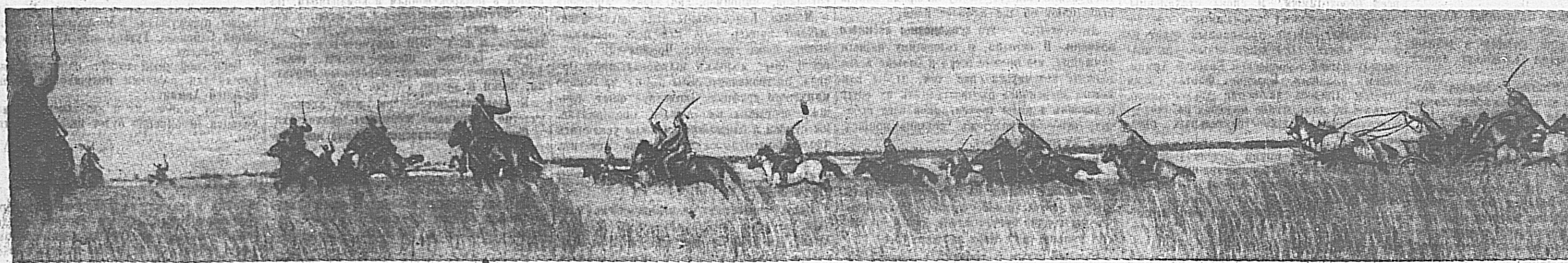
В Действующей армии. Атака красных конников на одном из участков Западного направления.

От Оленского Союза шоферов (Новая Зеландия) получены телеграммы следующего содержания: Оленский Союз шоферов заявляет народам Советского Союза о своей безоговорочной поддержке их борьбы с врагом всего человечества и выражает уверенность в быстром и успешном окончании войны против фашистской агрессии.