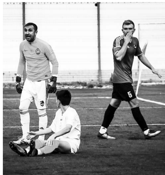
ПЕРШІСТЬ КИЇВЩИНИ-2019. ПІДСУМКОВА ТАБЛИЦЯ

Проте це були надії посісти друге місце в підсумковій таблиці. Однак для цього потрібно було перемагати у Білій Церкві місцеву команду. Та дива не трапилося. СК «Юніор» програв і залишився на третій сходинці першості.