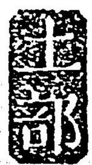
圖 同上 俗

團 マロシ 俗一扇ノト スルハ轉用ナリ 一直ニ扇ニ非ス 園 エン 一ツクニ 與圓 又音クワン 圖 ツ 分ル カタレ 力タチ 力カト