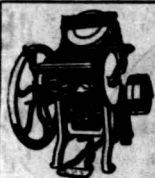
此車乃本廠所製之腳踏車也