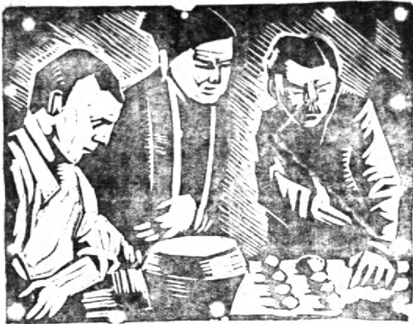
韋 鄂 木 刻