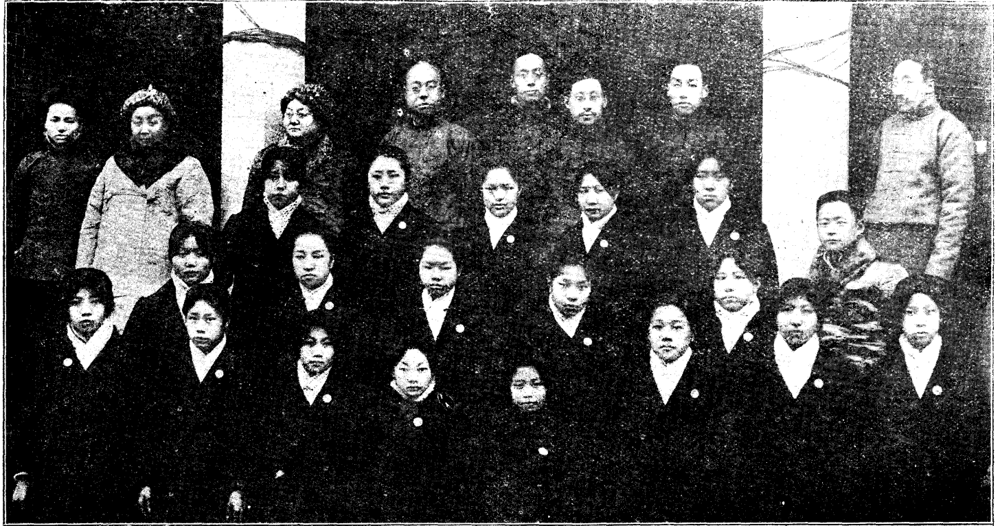
國民三年夏冬兩屆高初小學畢業業合影