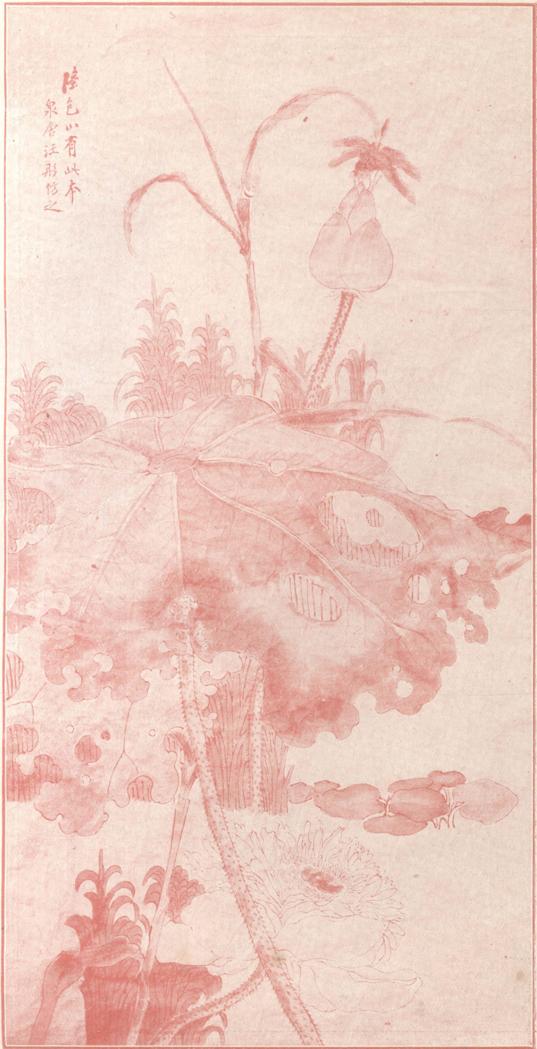
(一) 幅畫形汪生學科藝文