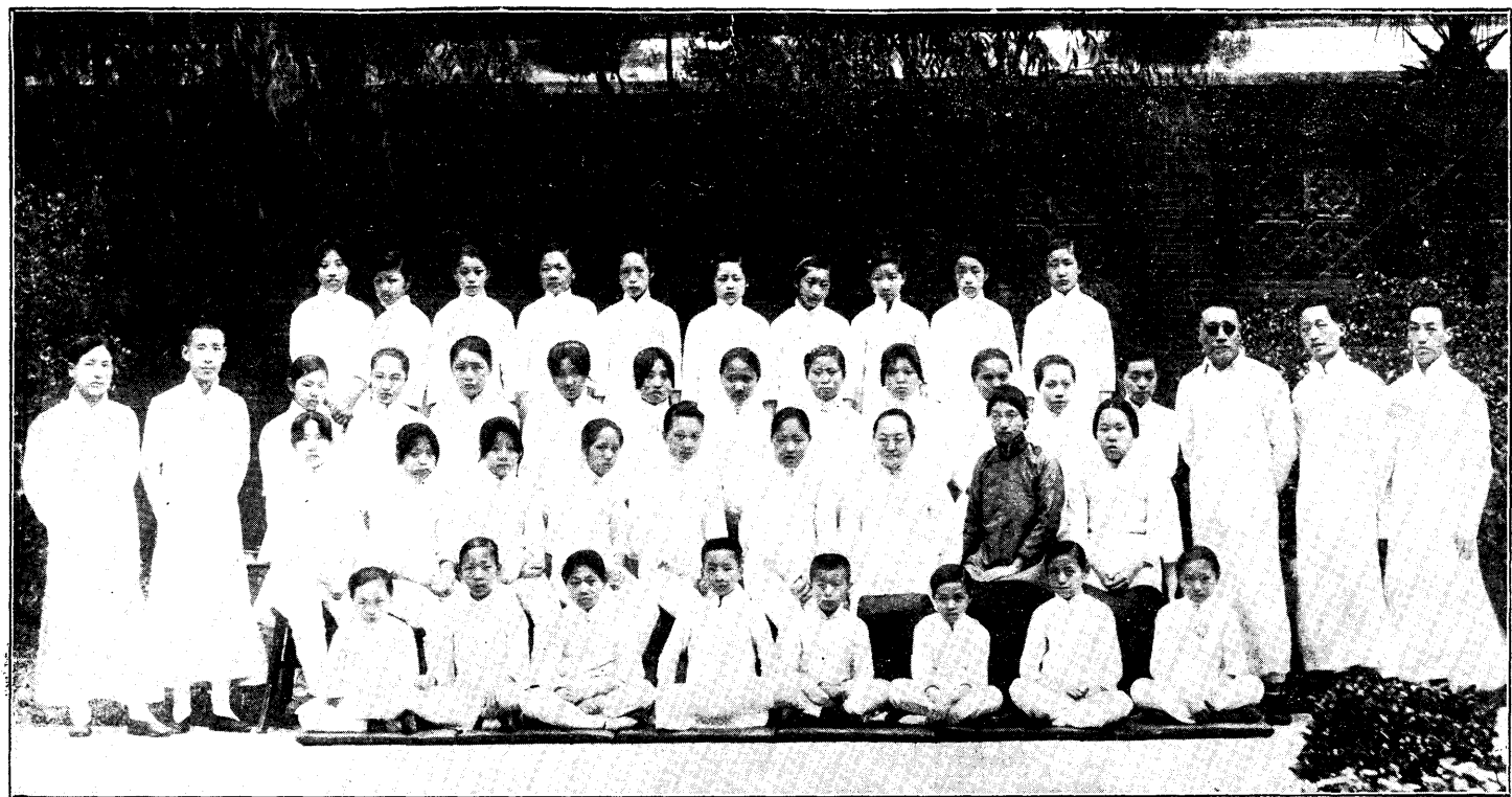
國民四年暑假暨初小畢業合影