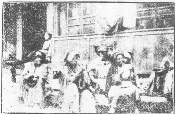
越島夷婦在漢族市街地紡織毛線情形