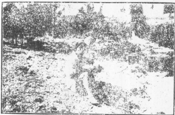
此系夷族除黑白夷外所稱水田也是