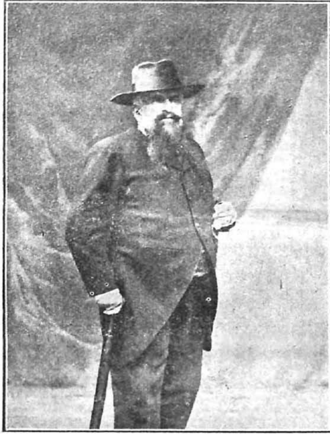
الدكتور غوستاف لوبونه