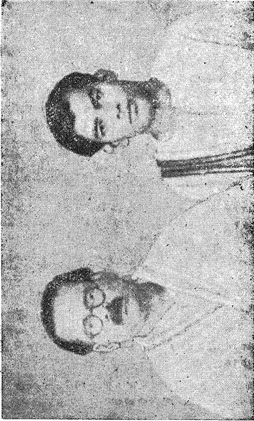
‘முல்லை’ இத்தின் ஆதரவாளர் பாரதிதாசனும் வெளியீட்டாளர் முல்லை முத்தையாவும்