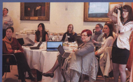
Aelodau o'r Gymdeithas Frenhinol, Llundain, ar sesiwn hyfforddi sgiliau Wikipedia.