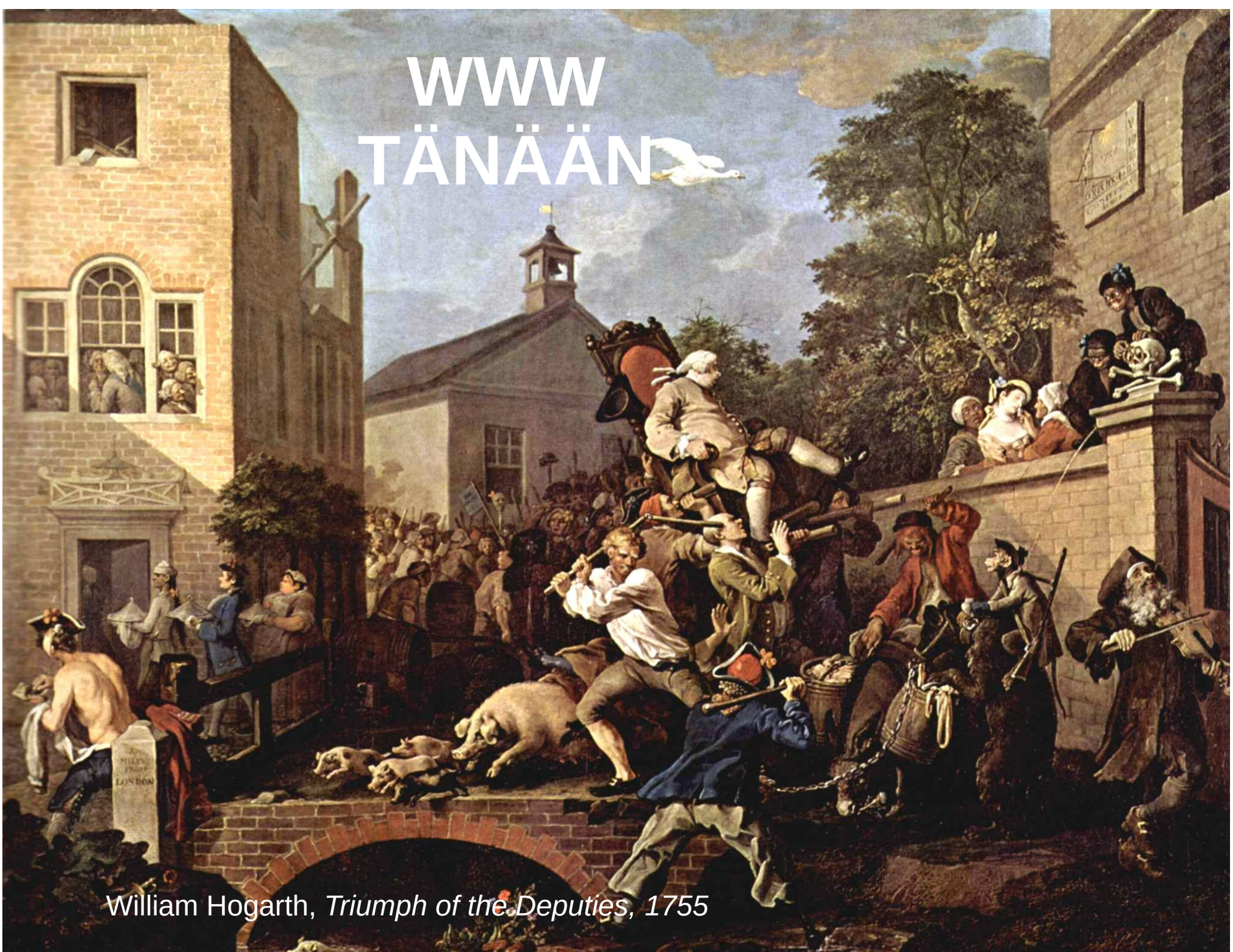
William Hogarth, Triumph of the Deputies , 1755