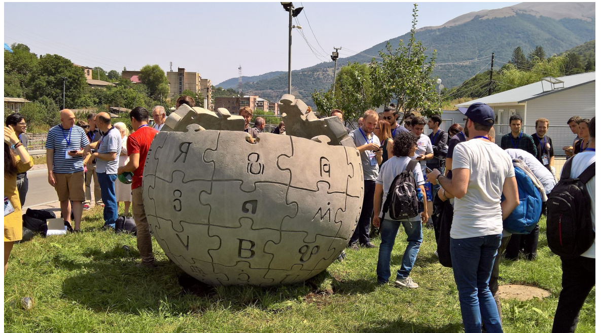
Keski- ja Itäeuroopan Wikimedioiden ja Wikipedioiden tapaaminen Dilijan, Armenia elokuu 2016.