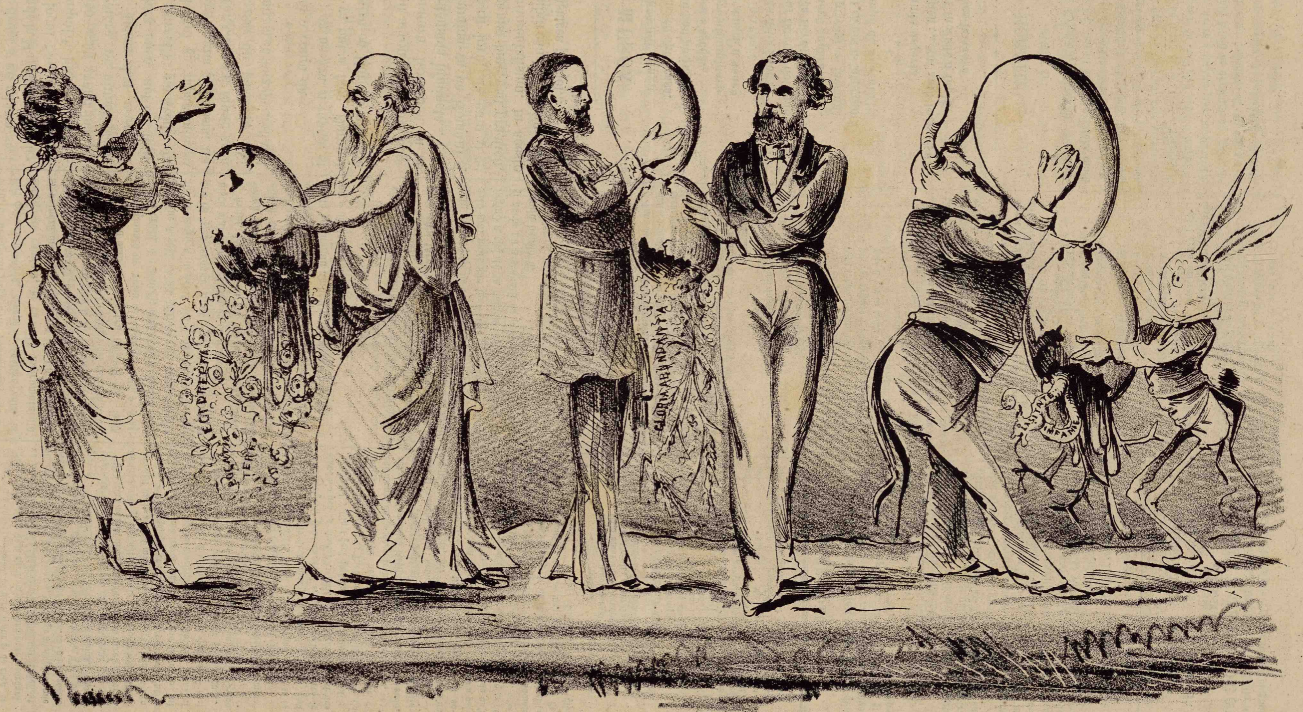
Situațiunea în ziua de ați.