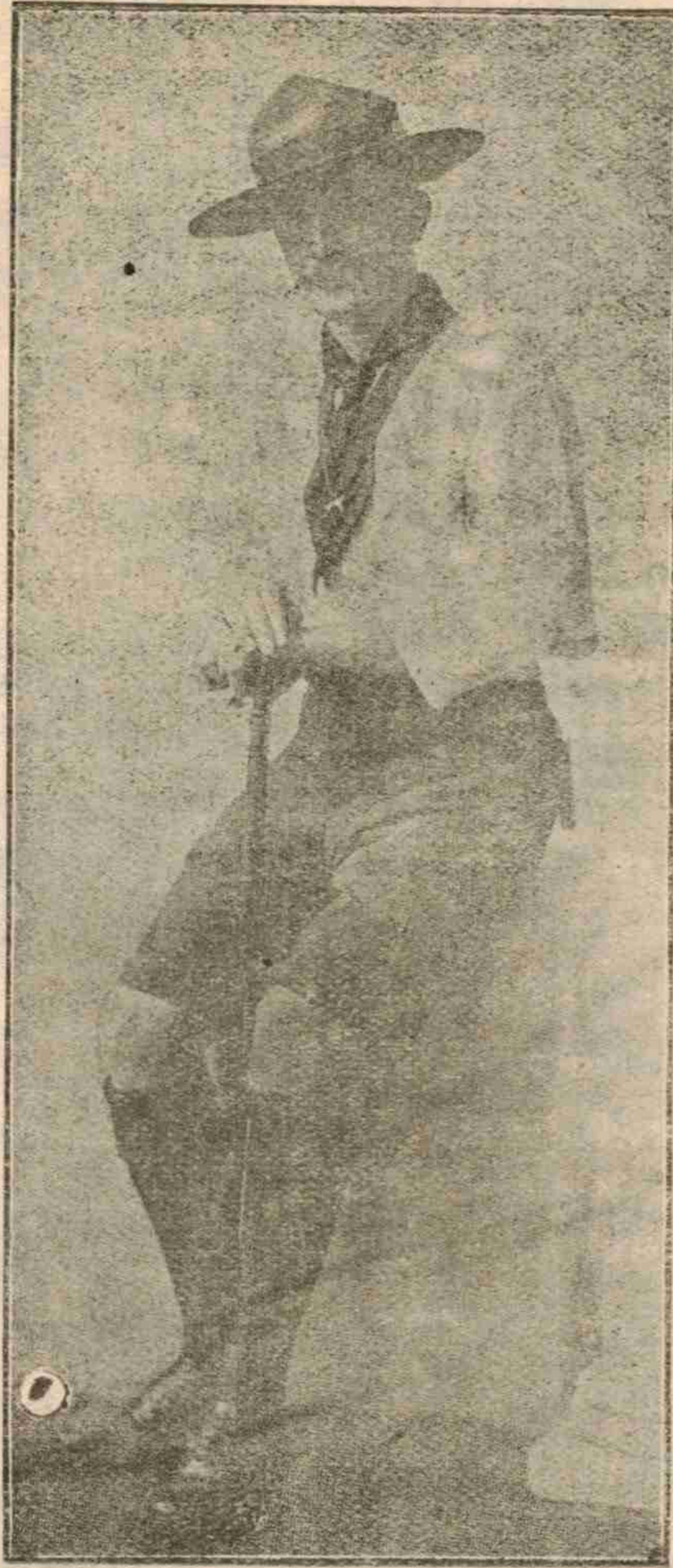
సర్ రాబర్టు బేడెన్ పవెల్,

ఈయుద్యమమును ౧౯౦౮ వ సం॥న సర్ రాబర్టు బేడెన్ పవెల్ అను మహనీయునివలన ఇంగ్లాండు దేశమునందు ప్రారం భింపబడినది. దక్షిణాఫ్రికా యందు బోయరుయుద్ధము జరు గుకాలమున, పెద్దవారికన్న పిల్ల లే తమకిచ్చినపనులను మిక్కిలి సామర్థ్యముతో నెరవేర్చగలరని కనుఁగొనిరి. ఒకసేననుండి మఱి యొకసేనకు రహస్యపు సందేశ ములను గొనిపోవుపనికి, పిల్లలను నియోగించిచూచిరి. సా ధారణులగుమనుజులు ఈకార్యములకు దిగుట కష్టతర ము. అనేకాపదలపాలు కావలయును. ఒక్కొక్కసారి శత్రువుల చేతిలోఁ జిక్కి హతము కావలసివచ్చును. బాల కు లిట్టికష్టములనన్నింటినియొర్చికొని బేడెన్ పవెల్ గారి