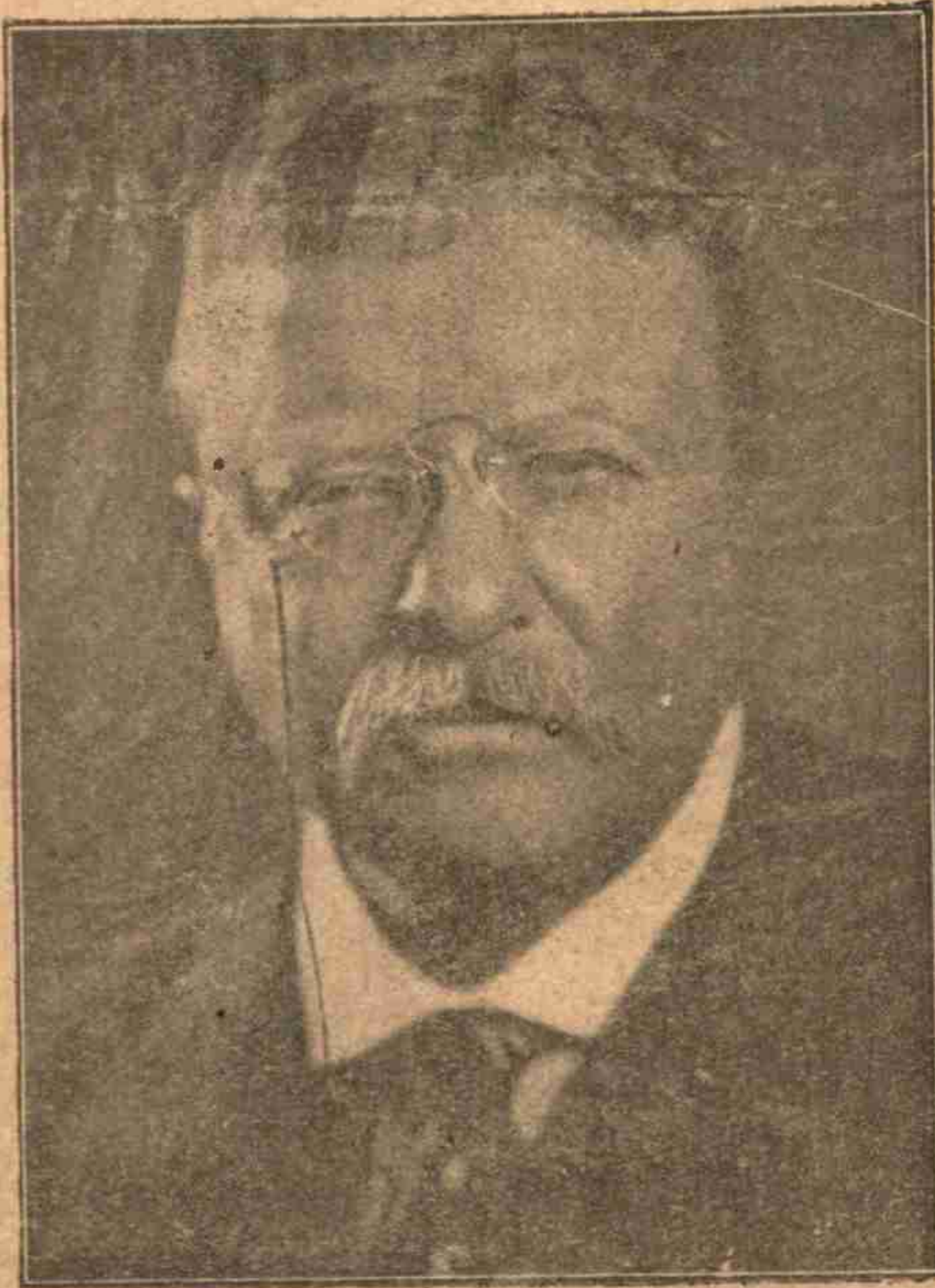
కలనల్ రూస్ వెల్టు.

ఇంగ్లాండు దేశమునం దీయు ద్యమమువలనఁ గలిగినమహా త్తర మైన ఫలితములను గుర్తెఱింగిన వారై ఆ మెరికా దేశస్థులీయుద్య మమును ౧౯౧౦ వ సంవత్సర మున తమ దేశమందు నెలకొల్పిరి. ఈ యుద్యమ వ్యాపనార్థమై ప్రథమమునందు దేశమున కంత కును బాతీయ సంఘమును నెలకొ ల్పిరి. పిమ్మట దేశమునం దక్క డక్కడ శాఖల నేర్పరచి పని చేయదొడంగిరి. దేశమునందంత టను యీయుద్యమమంత నొకే రీతిని జరుగుటకు గాను, ఈ యు ద్యమమును గూర్చి గ్రంథము నొకదానిని వ్రాసి ప్రకటించిరి. ఈయుద్యమము నా దేశ ప్రభు త్వమువారు గూడ నంగీకరించి,