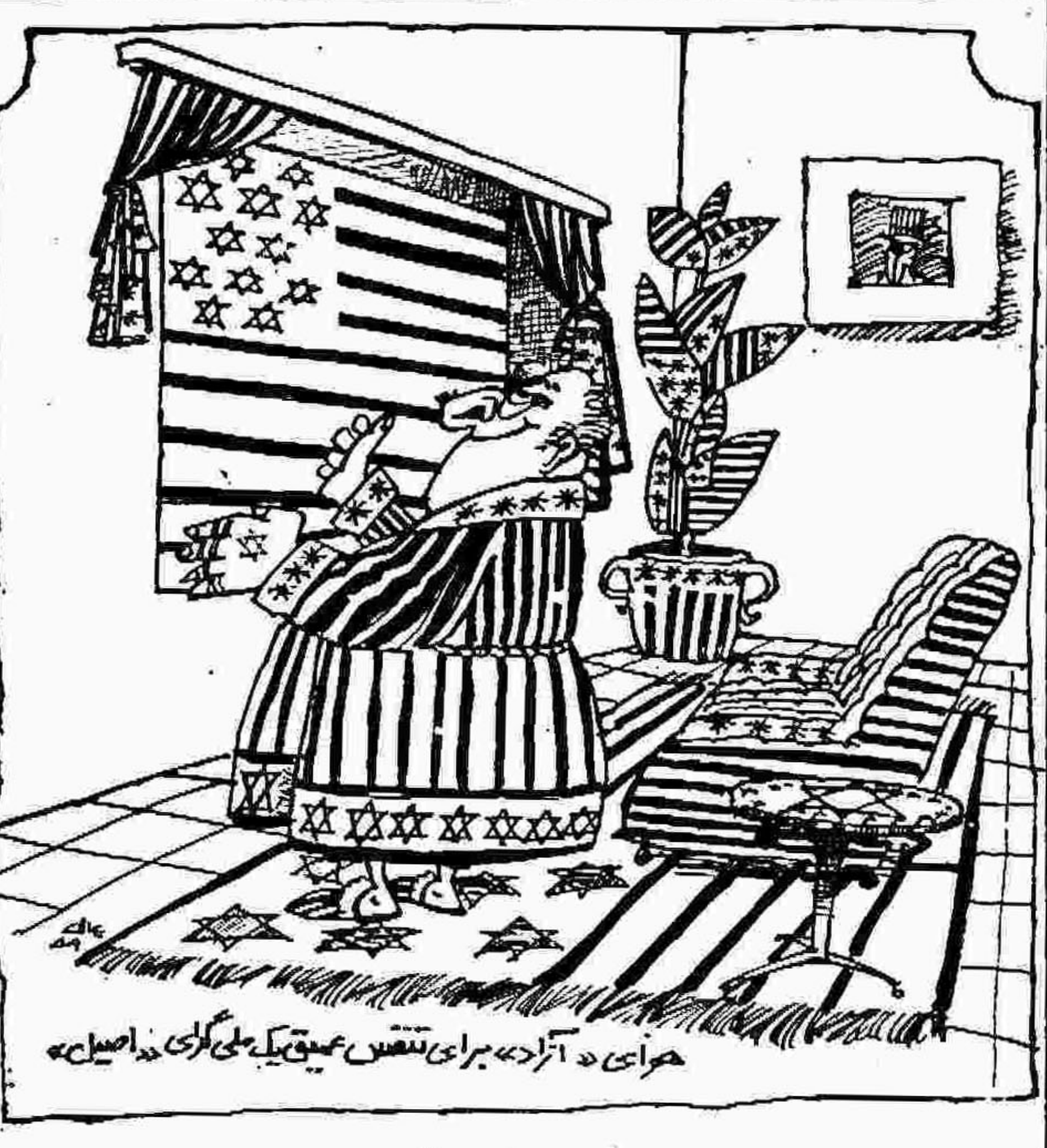
هرای «آزاد» برای تقویت عقیده ملی‌گرای اصیل