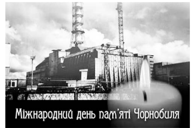
Міжнародний день пам'яті Чорнобиля

«М.в.» публікують цикл матеріалів, статей та спогадів очевидців тієї страшної техногенної екологічно-гуманітарної катастрофи. Вашій увазі замітки районки «Ленінська зоря» від 12 липня 1986 р. №83 (7146)