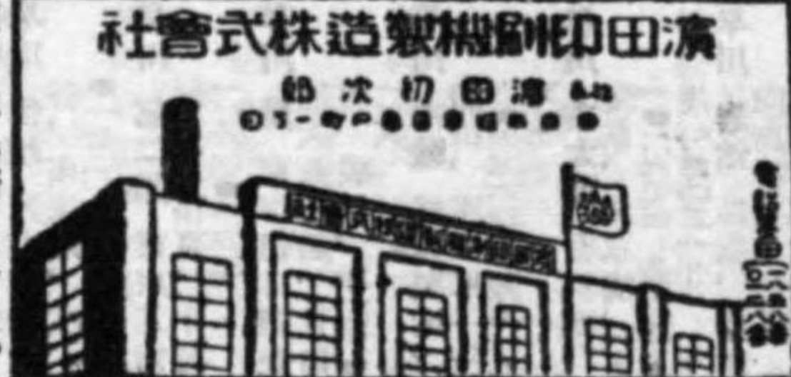
濱田印刷製機株式會社