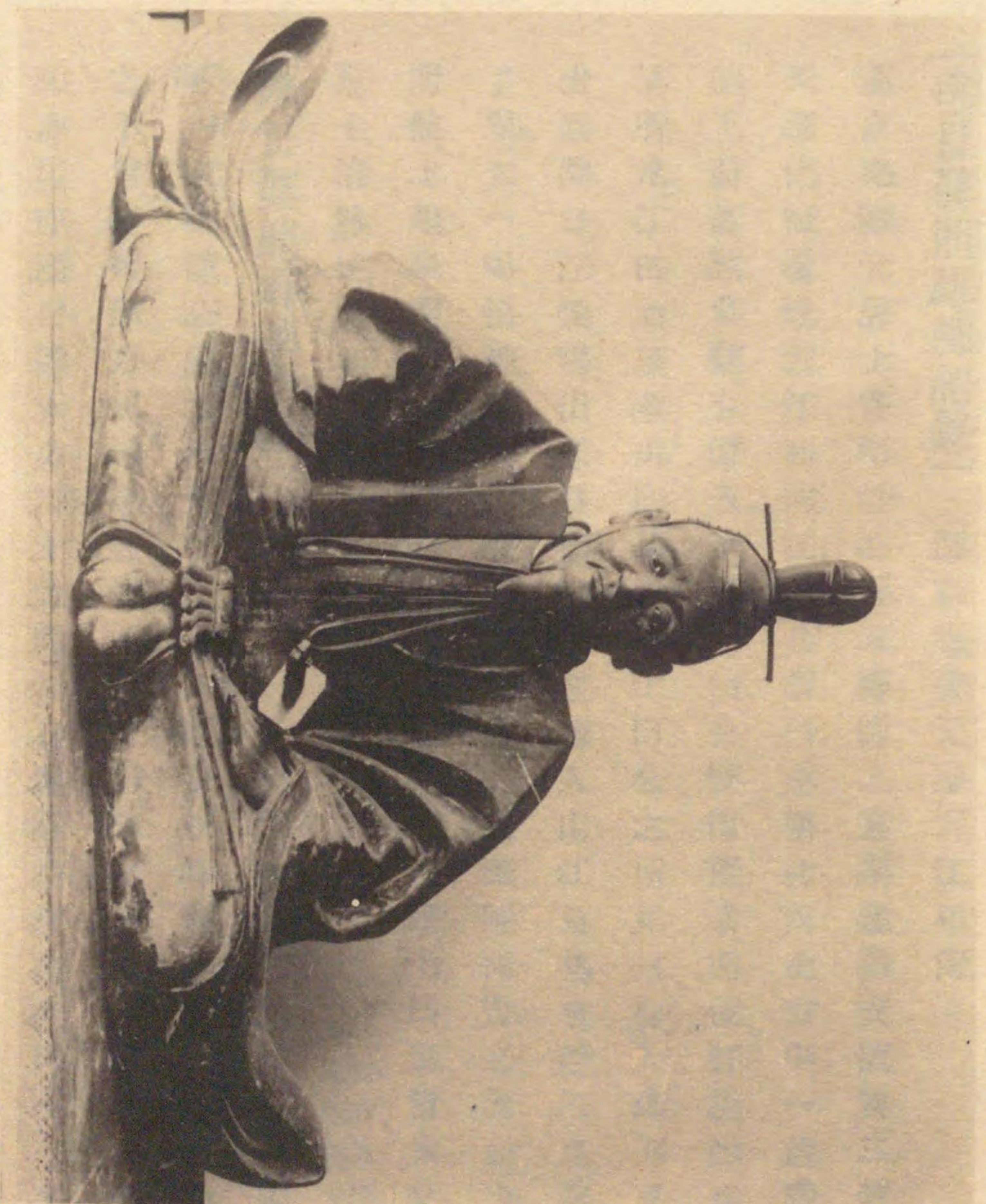
細川勝元木像 山城龍安寺所藏