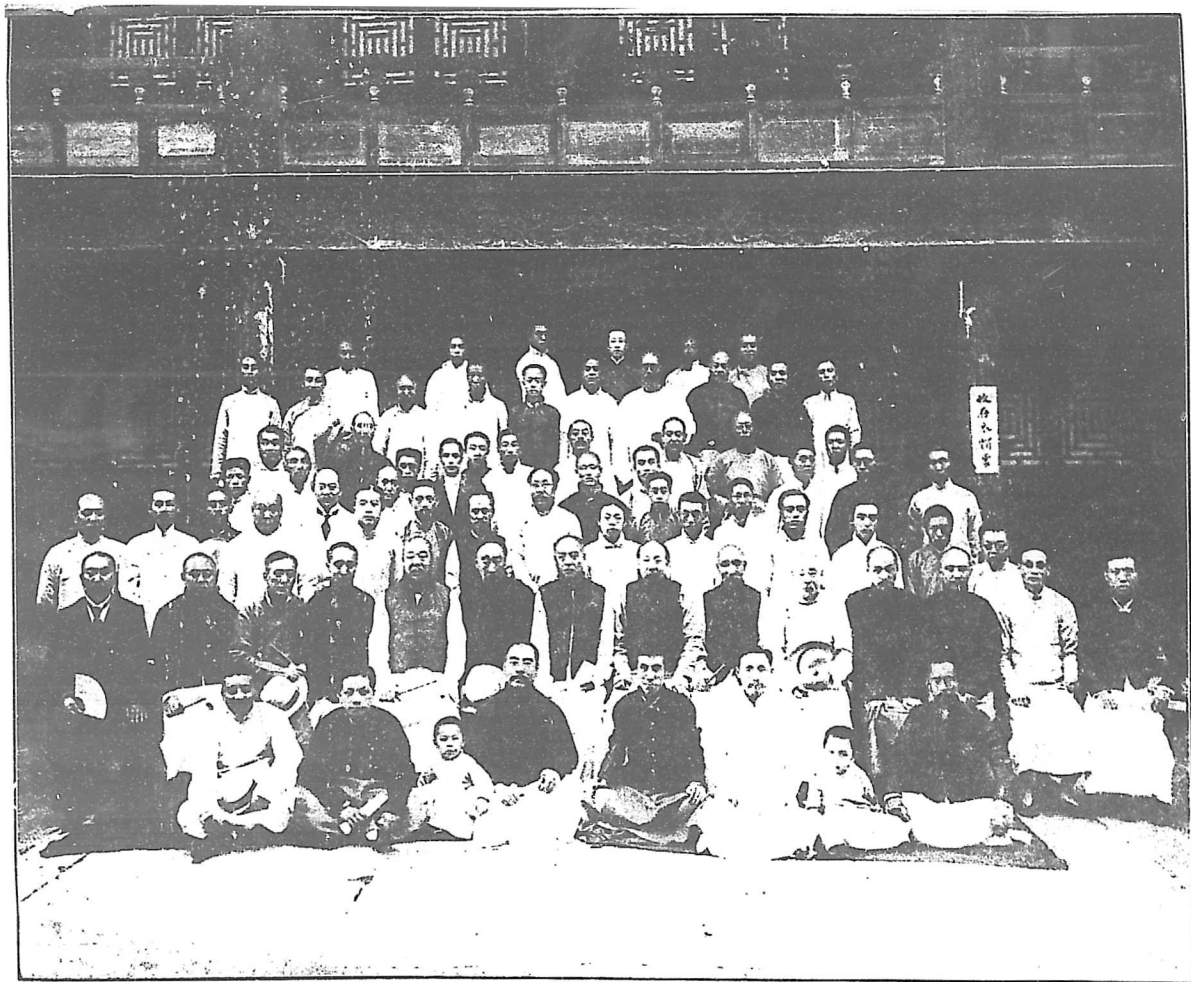
提 倡 內 國 公 債 會 第 二 次 大 會 攝 影