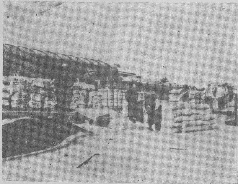
大宗漏稅走私之日本人造絲