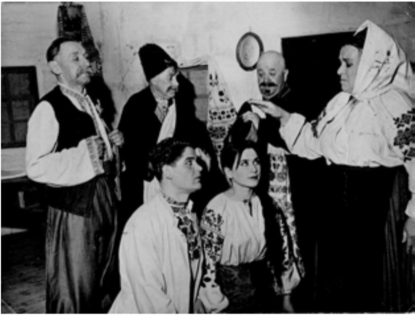
Виступ народного театру на фестивалі у Києві 1967 р.

За висловом упорядниць і авторок вступної статті до видання «Олена Пчілка – дітям» мати шістьох дітей «прищеплювала любов до народної творчості, вчила їх розумітися на фольклорі та етнографії, формувала малку їхні естетичні смаки».