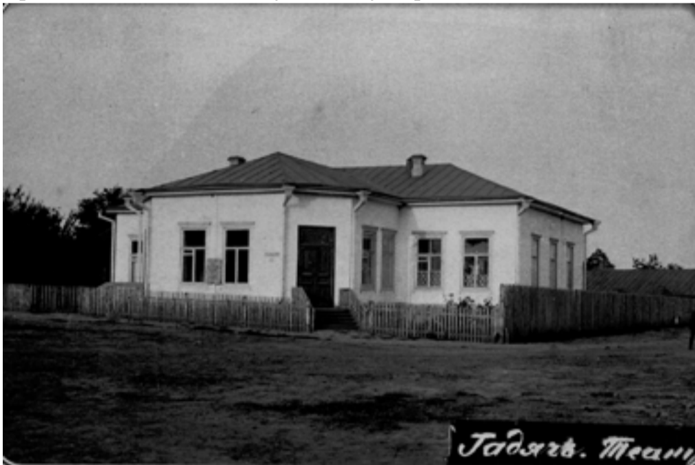
Гадяч. Народний дім

ної форми. Вхідні двері зі сходами розміщені на розі одного з кутів виступаючої вперед прибудови фасаду. Зліва від порогу два вікна, а між ними – пам'ятна дошка чи табличка. Пірамідальної форми дах по периметру опоясаний стічними ринвами з водовідводами на кожному куті. По обидва боки на даху забудови спостерігаємо два димарі. На жаль, світлина не дозволяє доповнити проекцію, розглянувши приміщення зусюдибіч. Дерев'яний штахетний паркан, що ним обгороджено будинок від вулиці, тягнеться углиб і зникає у перспективі. З цього можемо