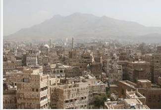
مدينة صنعاء القديمة