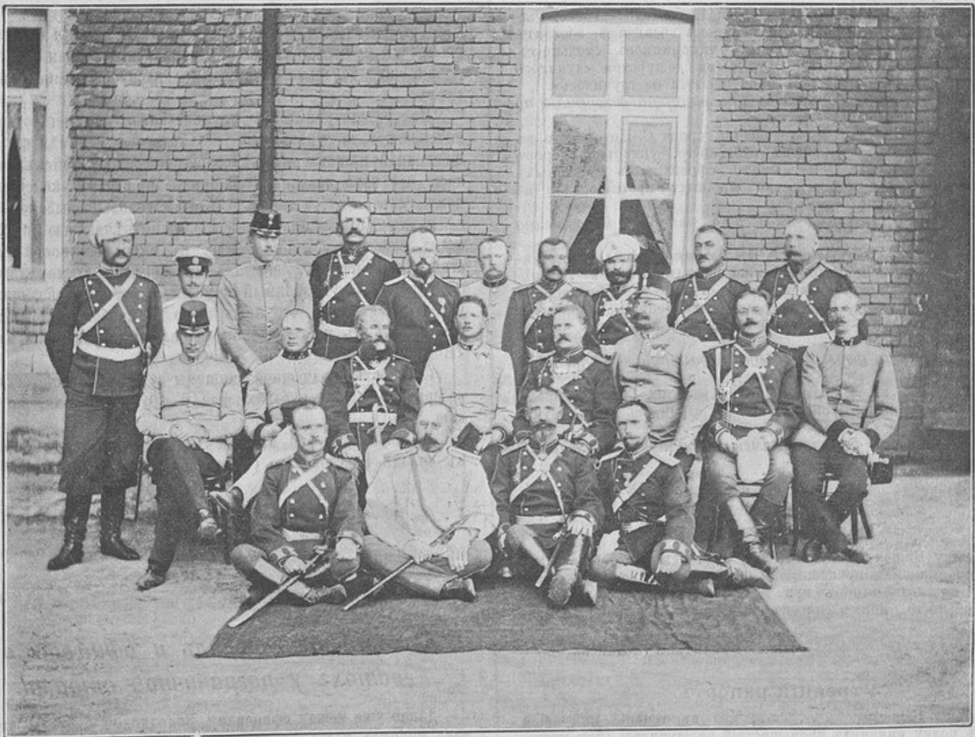
Австрійскіе генералъ и офицеры въ гостяхъ у пограничной стражи.