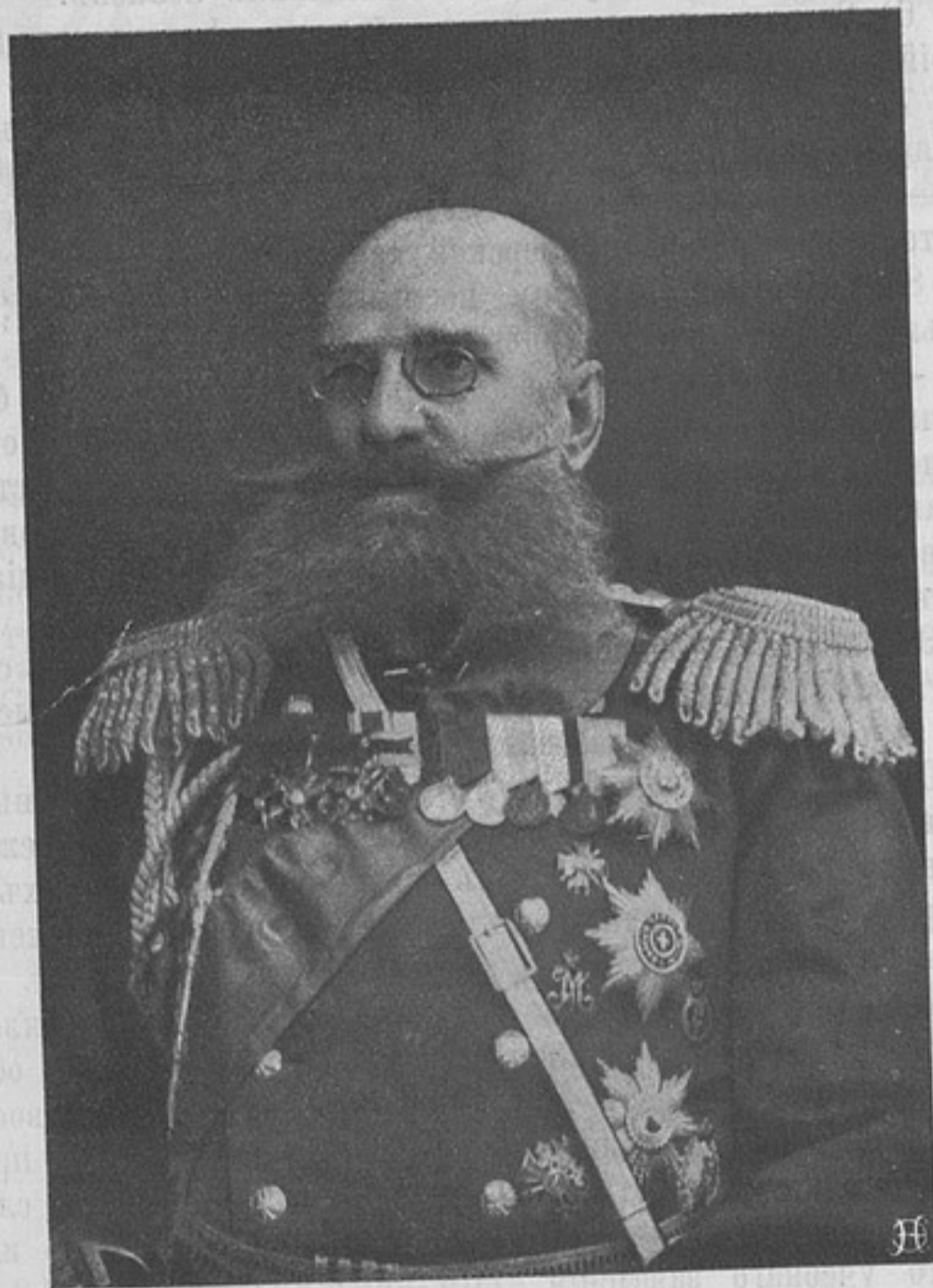
Командиръ 2-го Кавказскаго армейскаго корпуса, генераль-отъ-инфантеріи