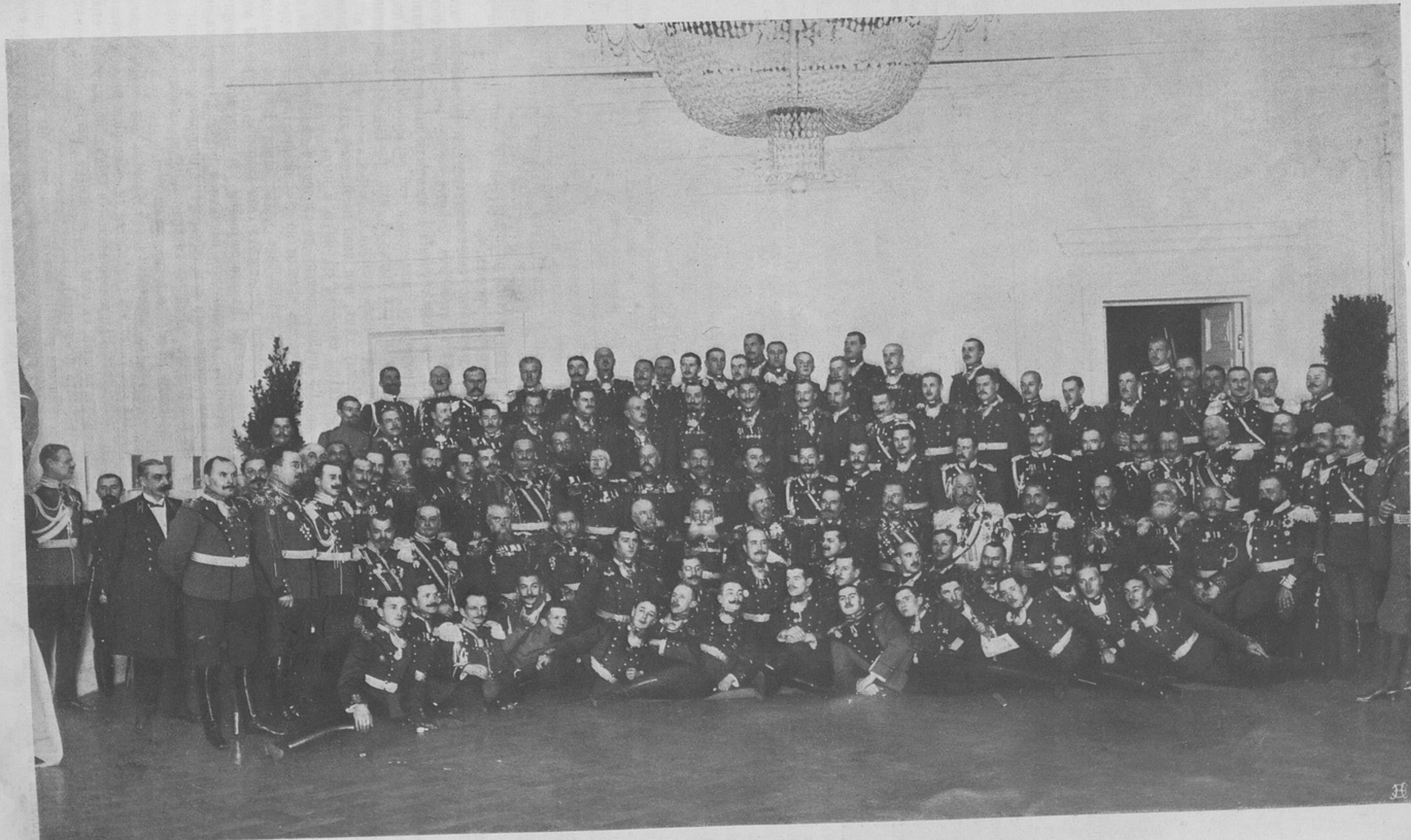
Офицеры л.-гв. Финляндскаго полка въ день ихъ полкового праздника 12-го декабря 1913 г.