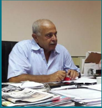
د. كمال حمدان: الزواج بين الدولة والمصارف «كاثوليكي»