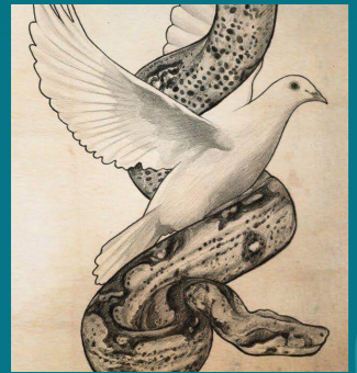
غراسيان وفن الحكمة الدنيوية