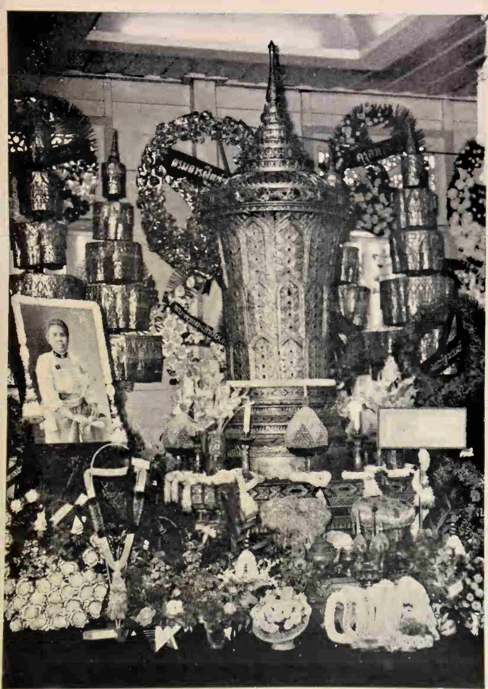
9/12/2565 โกศไทย ประกอบเกียรติยศศพ ท่านผู้หญิง เสวยม พระเสด็จจุเรนทรารัตนดี ในร้านพระภริยาเจ้าพระยาเสนาบดี