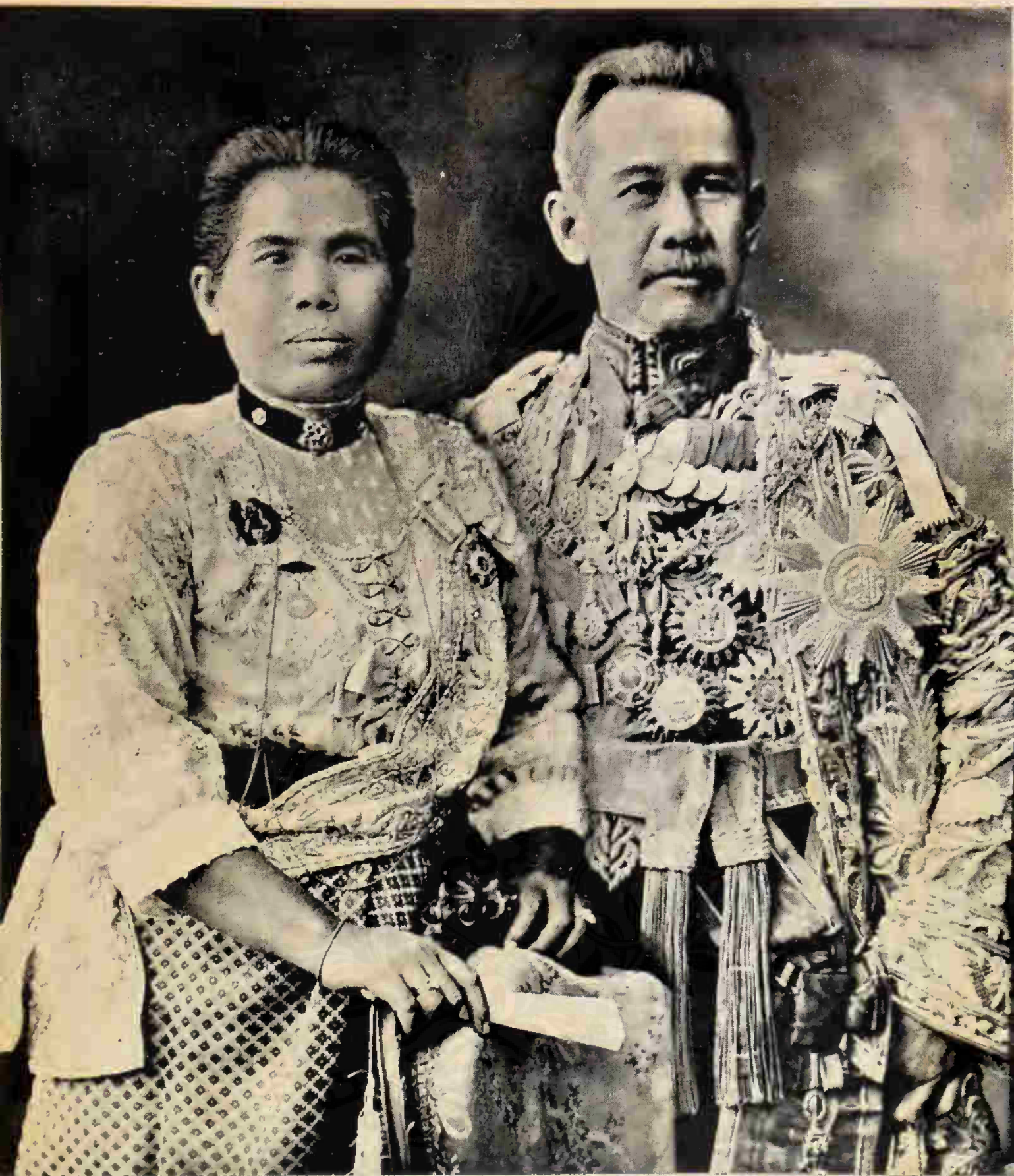
ท่านผู้หญิงเสงี่ยม และ เจ้าพระยาพระเสด็จสุเรนทราธิบดี