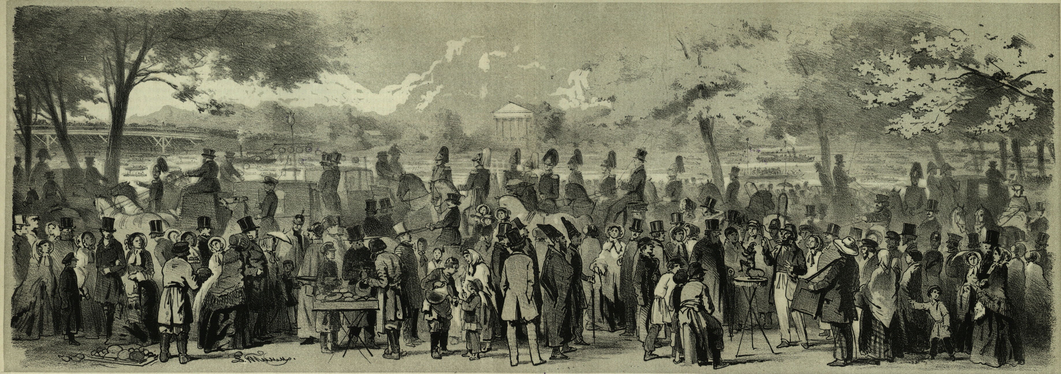
Гулянье на Елагиномъ Острову, 1 го Юля 1852 года.