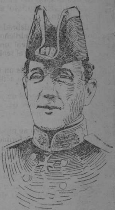
El almirante inglés sir Federico Starcke