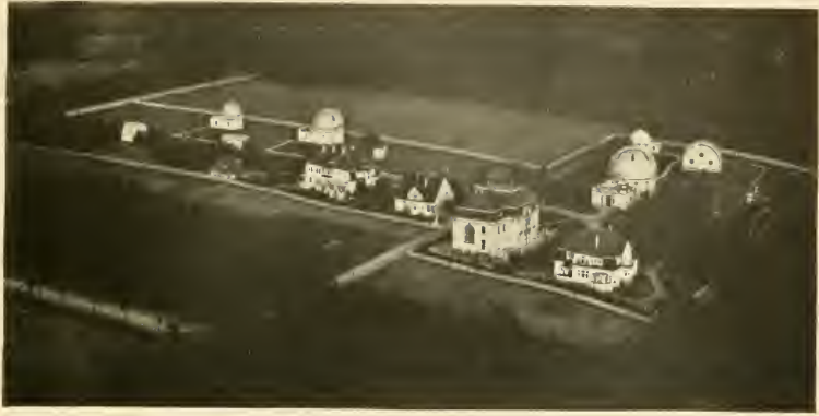
Die Hamburger Sternwarte in Bergedorf.