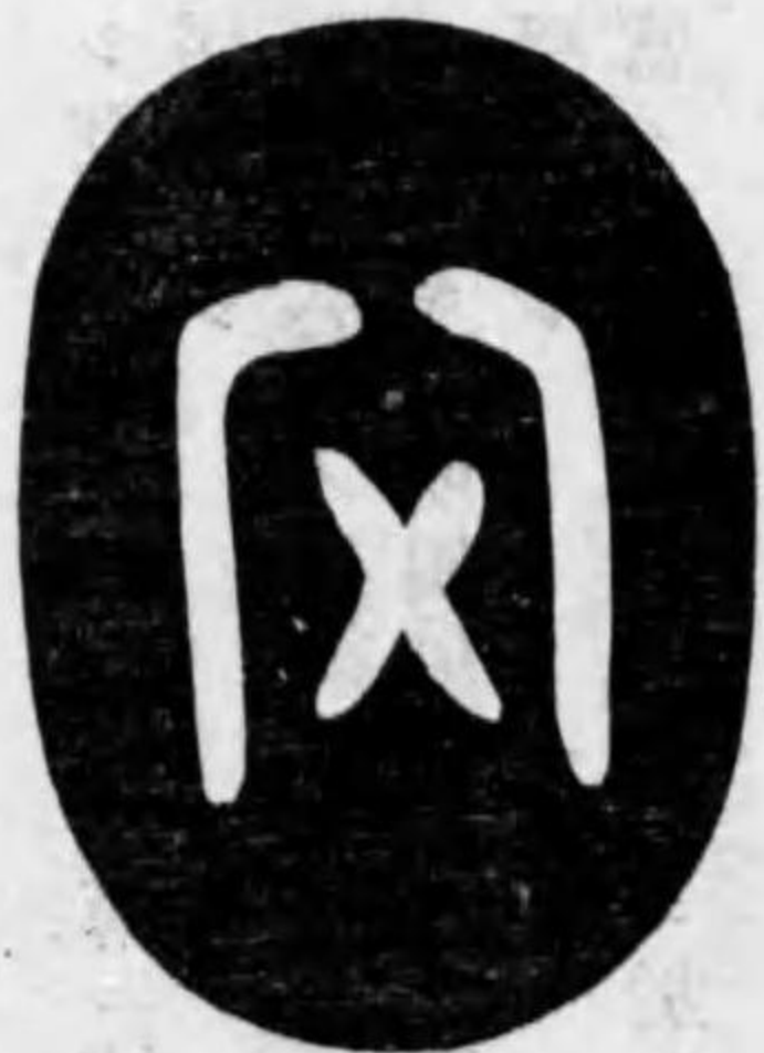
豎一寸八分 横一寸三分