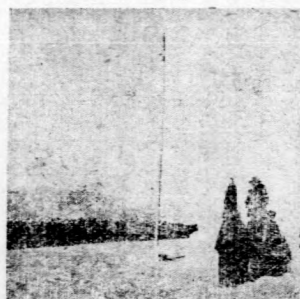
〈話加丁杜海青對座部〉

一本書，是一位駐紮中國邊界的緬甸英國軍官太所寫的，他說：『在邊界住了二十年，終年不見到幾個可談的朋友，不接近新的文化，不能有有趣的消遣，真幾乎要發瘋了，但是為了國家，要保護疆土，只好吃這苦，忍耐着罷！』吾看了這一段書，纔知道做邊疆軍官的生活之苦，非抱犧牲一切享受的決心，不能擔當這個重任。所以