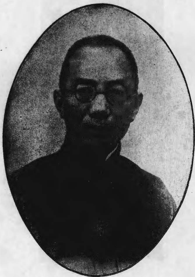
吳 主 席 肖 像