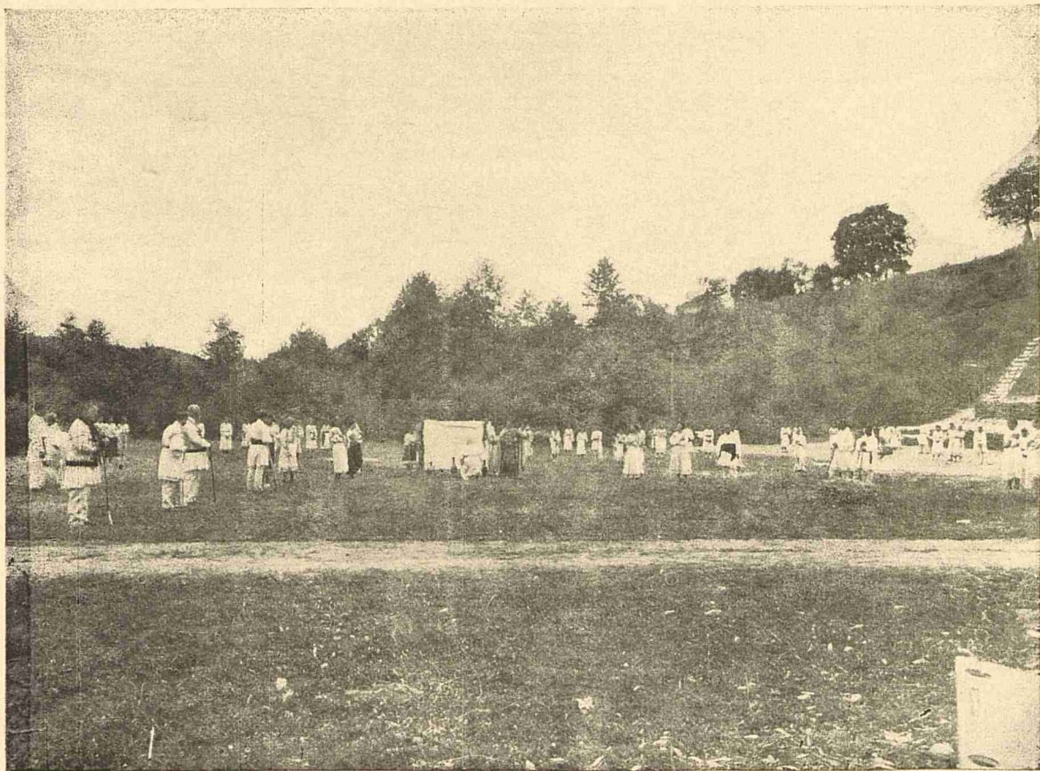
Actul I, 2.