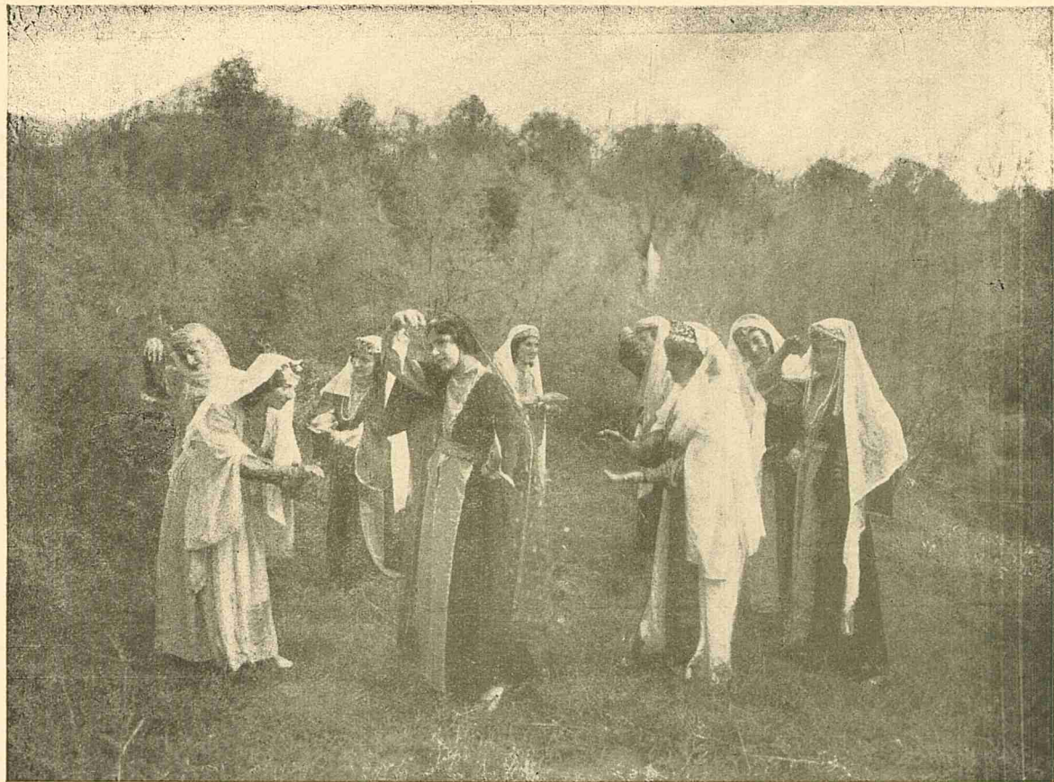
Actul I, 3.