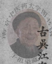
南京中医药大学图书馆藏 古吳江家楨忍庵訂

天年篇帝曰願聞人之始生何氣稟為基何立而為楮何失而死何得而生岐伯曰以母為基以父為楮失神者死得神者生也帝曰人之壽夭各有不同或卒死或久病願聞其道岐伯