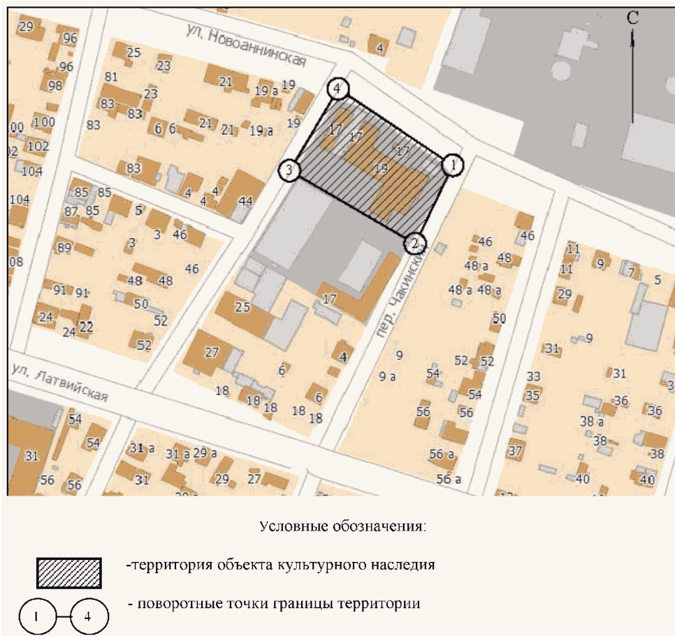
СХЕМА ГРАНИЦ ТЕРРИТОРИИ ОБЪЕКТА КУЛЬТУРНОГО НАСЛЕДИЯ ФЕДЕРАЛЬНОГО ЗНАЧЕНИЯ «ГОСУДАРСТВЕННЫЙ ИСТОРИКО- ЭТНОГРАФИЧЕСКИЙ И АРХИТЕКТУРНЫЙ МУЗЕЙ-ЗАПОВЕДНИК «СТАРАЯ САРЕПТА», РАСПОЛОЖЕННОГО ПО АДРЕСУ: ВОЛГОГРАДСКАЯ ОБЛАСТЬ, г. ВОЛГОГРАД, КРАСНОАРМЕЙСКИЙ РАЙОН (ТЕРРИТОРИЯ № 2)