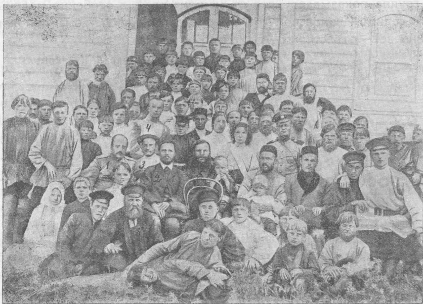
Группа слушателей курсовъ пчеловодства въ с. Ивановскомъ.

изъ школы знаній, чтобы показать этимъ добрый примѣръ. Лектора по земледѣлю задержала выставка; на курсахъ же пчеловодства и садоводства слушатели поражали своей работоспособно-