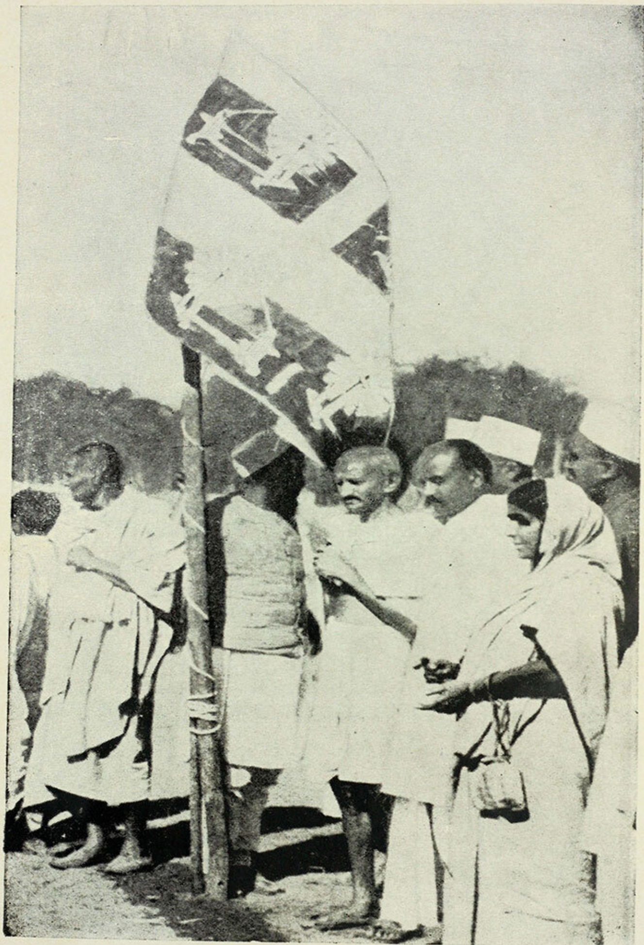
અમદાવાદ કોંગ્રેસમાં, ૧૯૨૧