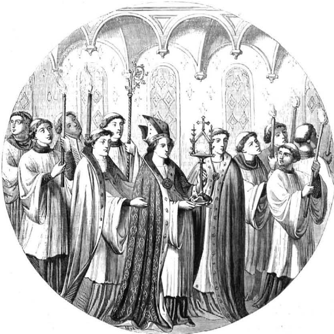
PROCESION DEL CORPUS EN EL SIGLO XIV. (DE UN MISAL DE S. CUCUFATE DEL VALLÉS).

el capiscol y dos obreros de la ciudad á arreglar la procesion, organizase esta por el órden siguiente: el dragon, diablillos, gigantes y demás entremeses que hubiere; la música de la ciudad con sobrevestas y sombreros de raso carmesí; la bandera de santa Eulalia (18) llevada por un sacerdote á caballo, el mismo que la tarde anterior hizo la ronda de la procesion revestido de amitos blancos, con una dalmática de terciopelo toda recamada de oro, y puesta en la cabeza una linda corona de plata sobre la cual descuelga la cruz de santa Eulalia y en medio de esta la del cabildo; los pendones ó gonfalones de las parroquias; lu-