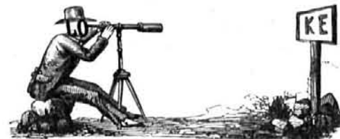
SOLUCION DEL ANTERIOR.