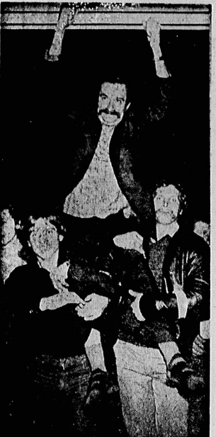
ملخو لسا، رهبر اتحادیه همبستگی

کویسیل در بیانیه خود اعلام کرد که دولت باید اقدامات فوری را برای حل بحران اتخاذ کند. او همچنین اعلام کرد که دولت باید اقدامات فوری را برای حل بحران اتخاذ کند.