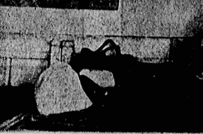
یک خانواده سنتی لهستانی در زیر عکس ها در اوردان پرتواریا

کمیسیون ماده غذایی لهستان ۲۸ میلیارد دلار در ماه برای خرید مواد غذایی از خارج نیاز دارد. این کمیسیون اعلام کرد که دولت باید اقدامات فوری را برای حل بحران اتخاذ کند.